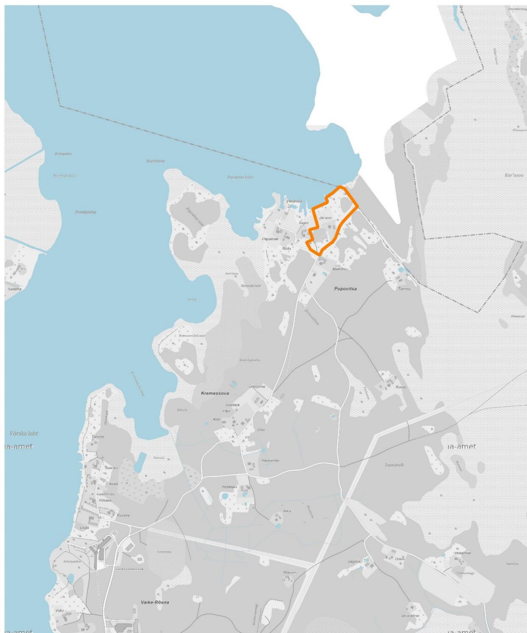
Kaart 1. Arheoloogilise leiukoha asukoht.