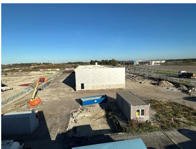
Pilt 2. Olukord Epleri kinnistul 19.09.24 seisuga (pildi keskel valmiv vastuvõtuhall/viihall)