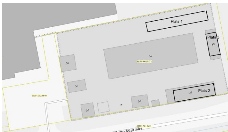
Plaan 1. Epleri kehtiva keskkonnakompleksloa lisaks olev jäätmete ladustamisplaan.