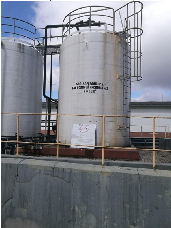
Eesti elektrijaama keemilise veepuhastuse mahutite kompleks.