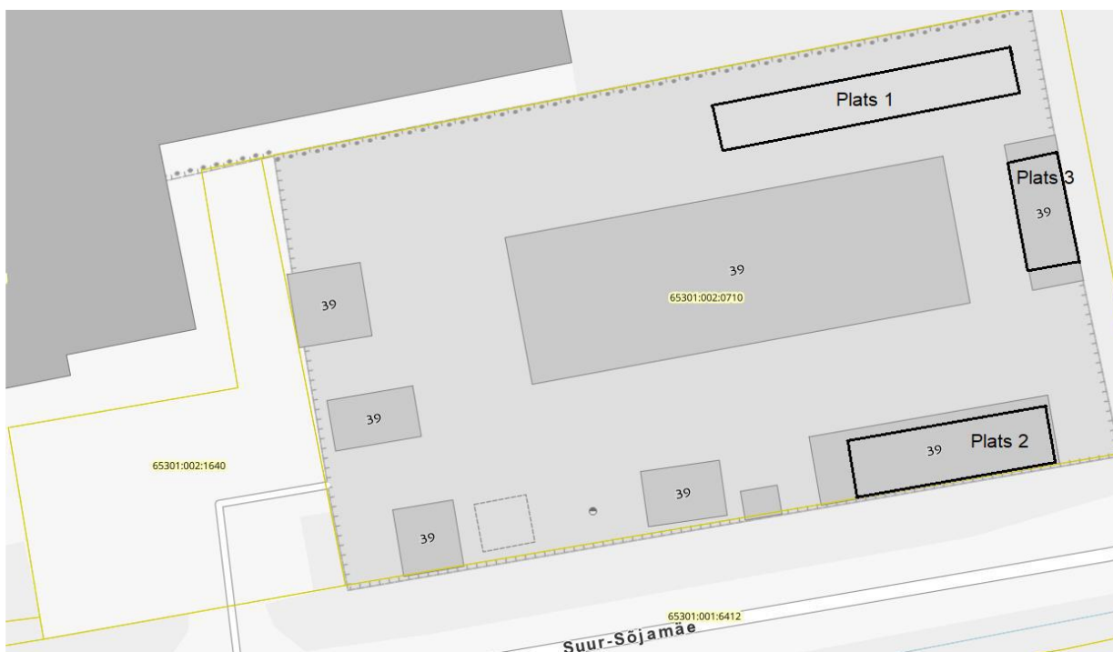
Plaan 1. Epleri kehtiva keskkonnakompleksloa lisaks olev jäätmete ladustamisplaan.