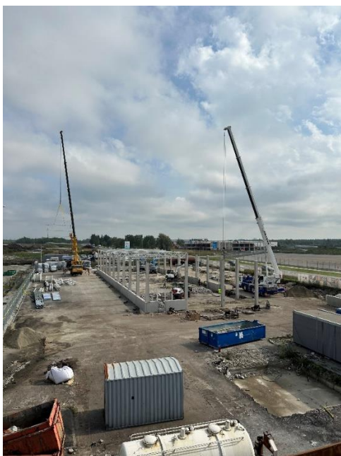
Pilt 3. Olukord Epleri kinnistul 03.09.24 seisuga (pildi keskel valmiv vastuvõtuhall/viilhall)