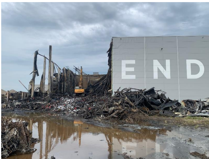
Pilt 1. Pakendikeskuse hoone pärast põlengut