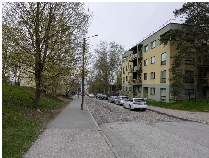
Foto 2. Vasakul: trepp, mis ühendab Lille mäe Riia tänavaga. Paremal: Lille tänava sõidutee on planeeringualast Kalevi tänava suunas kaetud munakivikatendiga, jalgteed kahel pool tänavat asfalt- või sillutiskatendiga.

Lähimad bussipeatused ja rattaringluse parklad on toodud planeeringu funktsionaalsete seoste joonisel (joonis 1).