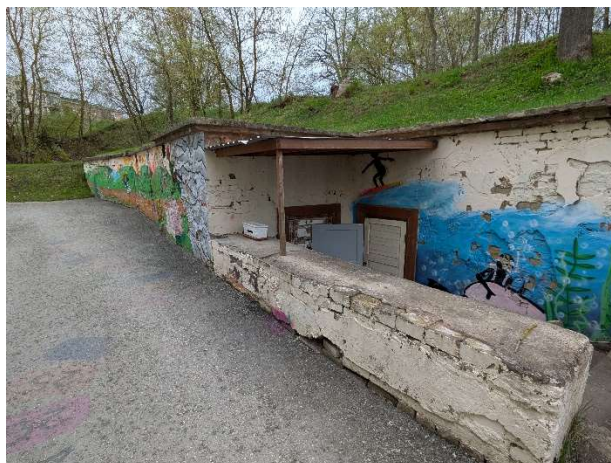
Foto 1. Vasakul: Vaade planeeringuala keskosale – taustal Tartu maakohtu hoone. Paremal: Planeeringuala vahetus läheduses paiknev kelder ( fotod: Kadri Kattai, 2025 ).