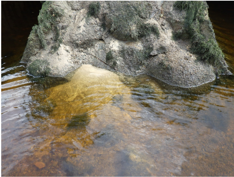
Foto 7. Pinnase väljakanne truubi alaveepoolel filtratsioonivee toimel (torude vahakohas)