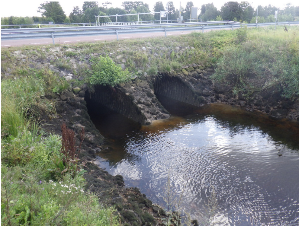
Foto 2. Vaade truibile alavee poolt