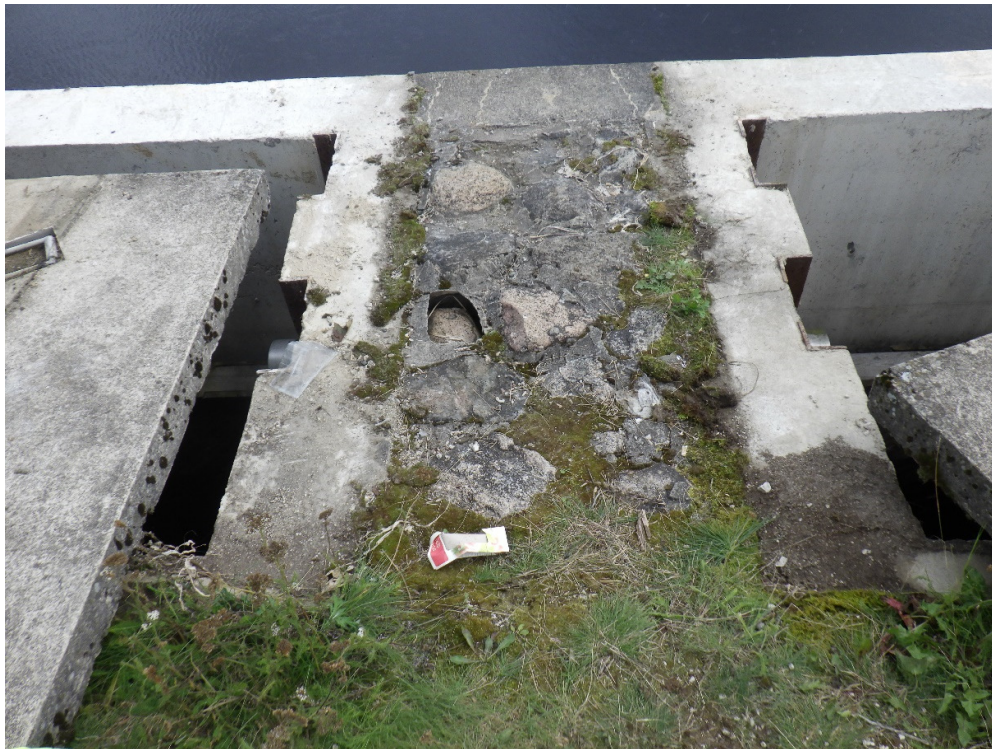
Foto 6. Vajunud kivi otsaku kambrite vahelkohas