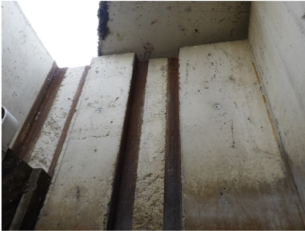
Foto 11. Otsaku kambri sisevaade