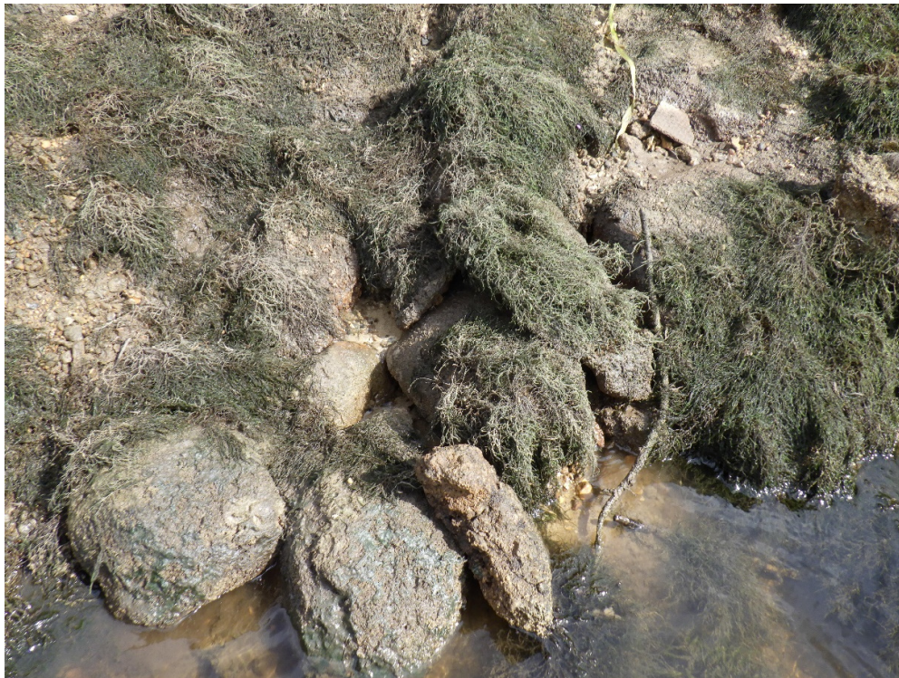
Foto 8. Pinnase väljakanne truubi alaveepoolel filtratsioonivee toimel (parema kalda pool)