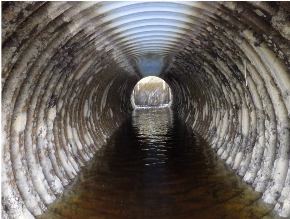
Foto 12. Vaade torusse alavee poolt