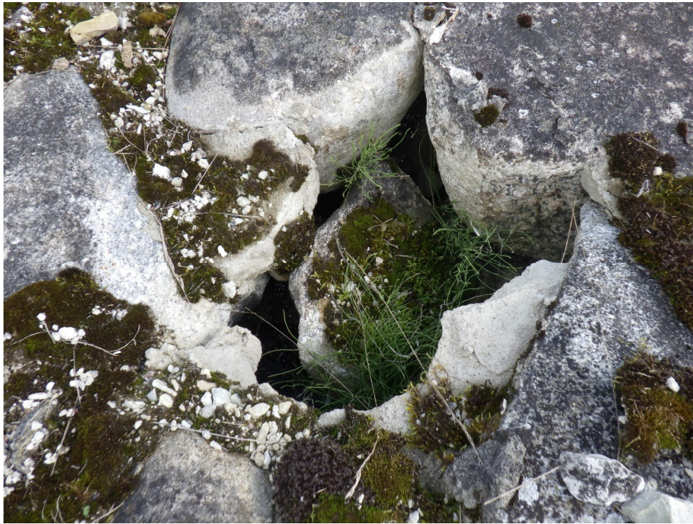
Foto 5. Kahjustunud kivikindlustis ülavee pool