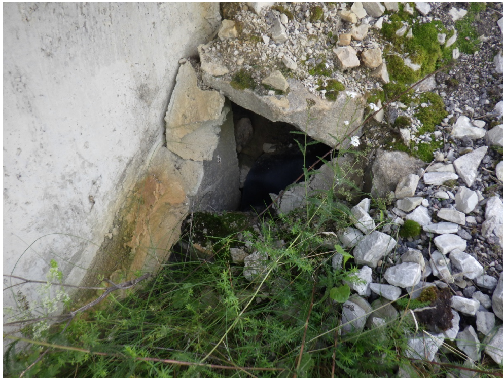
Foto 4. Tühemik otsaku parempoolse (lõunapoolse) külje teepoolse nurga juures