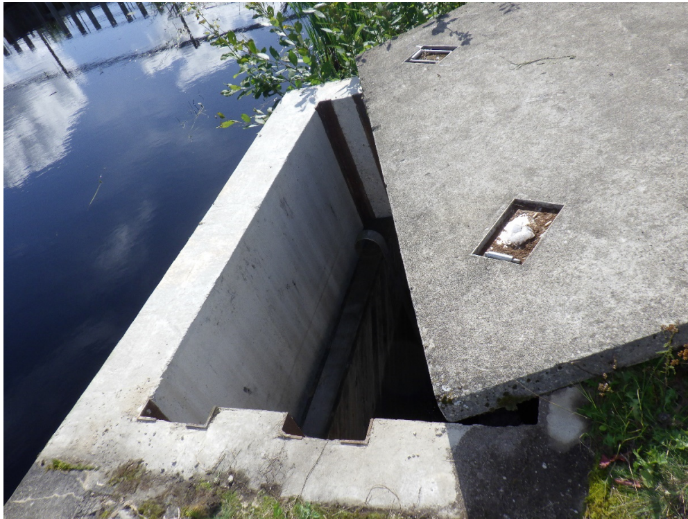
Foto 3. Otsak