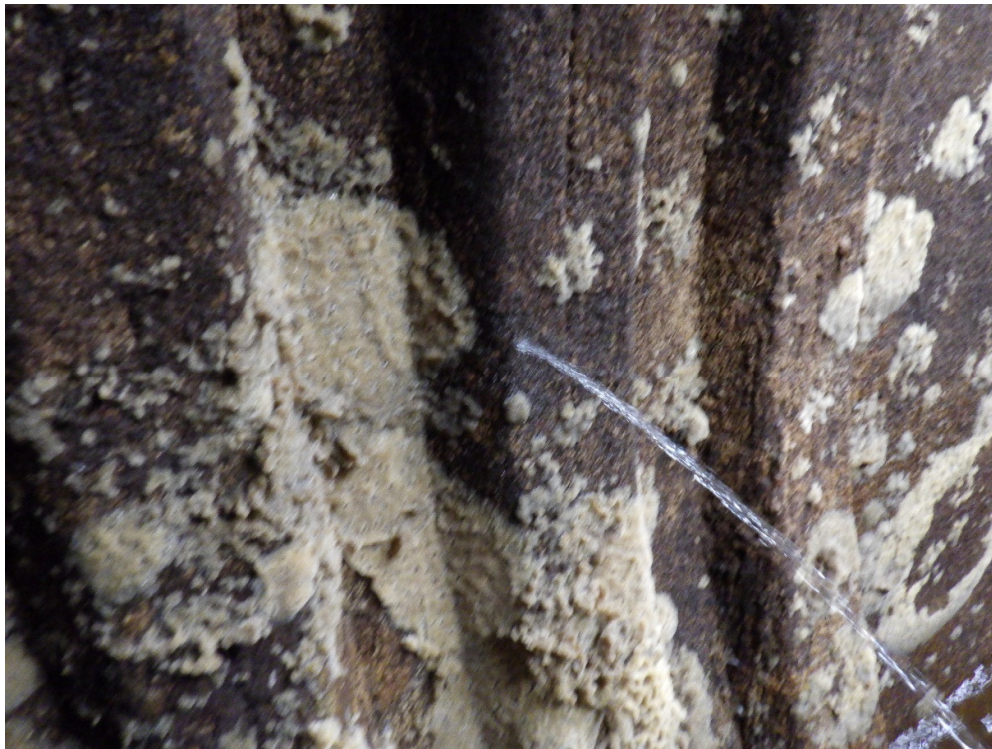
Foto 14. Filtratsioonivee läbivool avast parempoolses (lõunapoolses) torus