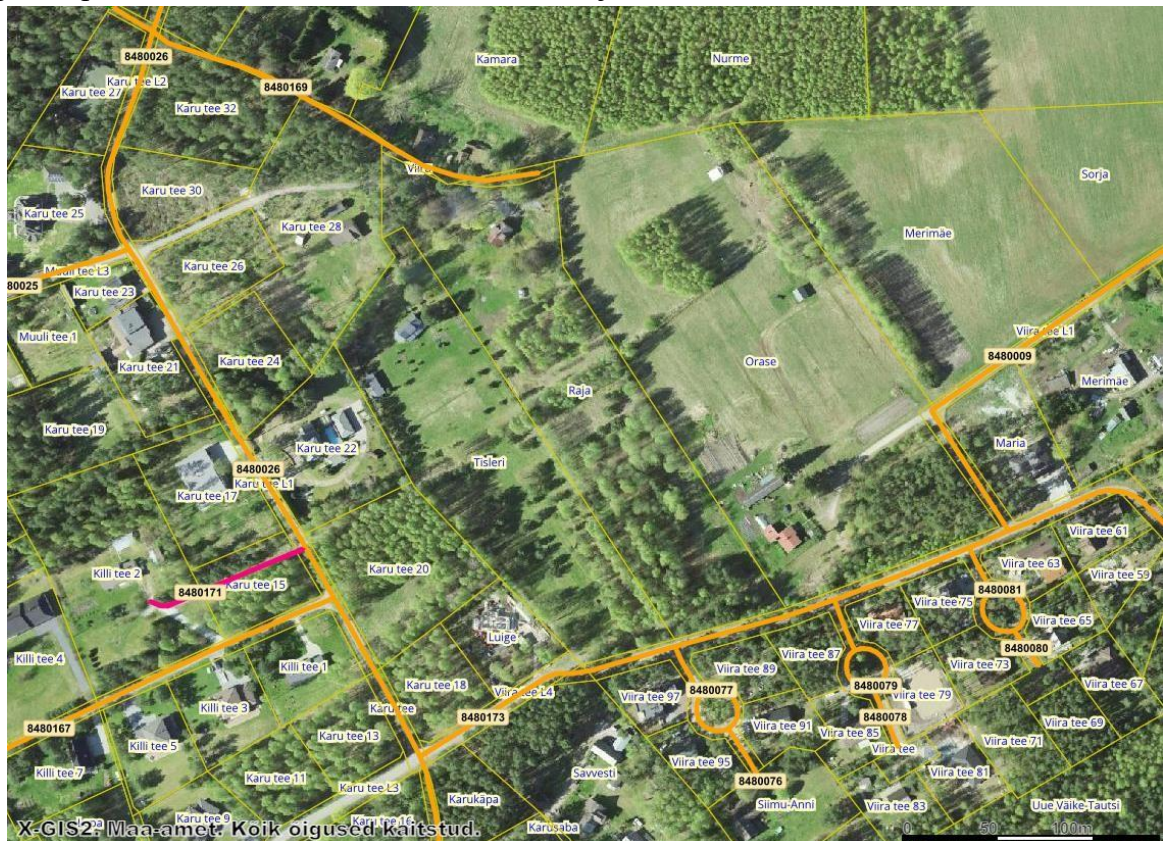
Joonis 4. Avalikud kohalikud teed märgitud oranžiga.

juurdepääs kinnistule on näidatud detailplaneeringu põhijoonisel. Planeeritav juurdepääsutee määratakse avalikku kasutusse ja võõrandatakse vallale.