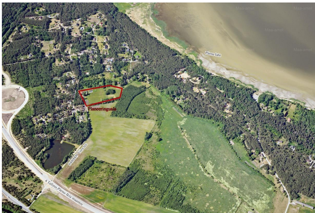
Joonis 2. Väljavõte Maa-ameti fotolao lehelt.

Planeeringuala paikneb hajaasutus piirkonnas, Häädemeeste vallas, Reiu külas 4 TallinnPärnu-Ikla maantee ja Pärnu lahe vahelisel alal. Planeeringualal on olemasolevad hooned ning tehnovõrgud. Ala on kaetud enamjaolt loodusliku rohumaa ning planeeringu lõunaosas puistuga. Planeeringuala asub hajaasustuses mitmete hoonestatud ja hoonestamata maatulundusmaa sihtotstarbega kinnistute vahel. Planeeringuala lähedase elamupiirkonna hoonestus on valdavalt viil- ja kaldkatustega kahekorruselised üksikelamud ning nende abihooned. Lähim bussipeatus „Reiu tee“ asub ca 1 km kaugusel planeeringualast, 4 Tallinn-Pärnu-Ikla maanteel.