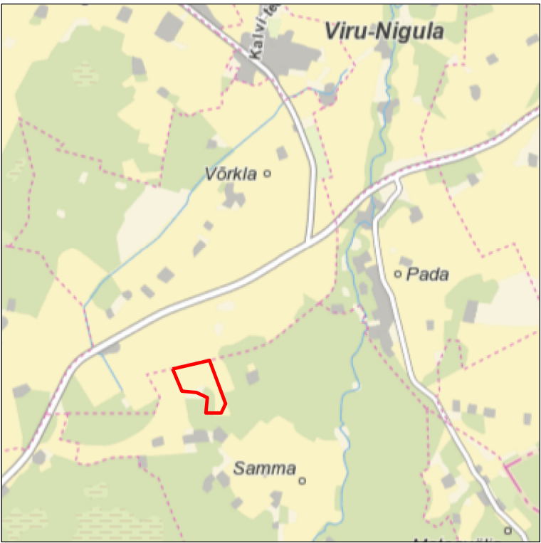
Kaardileht nr 6443 Kiviõli