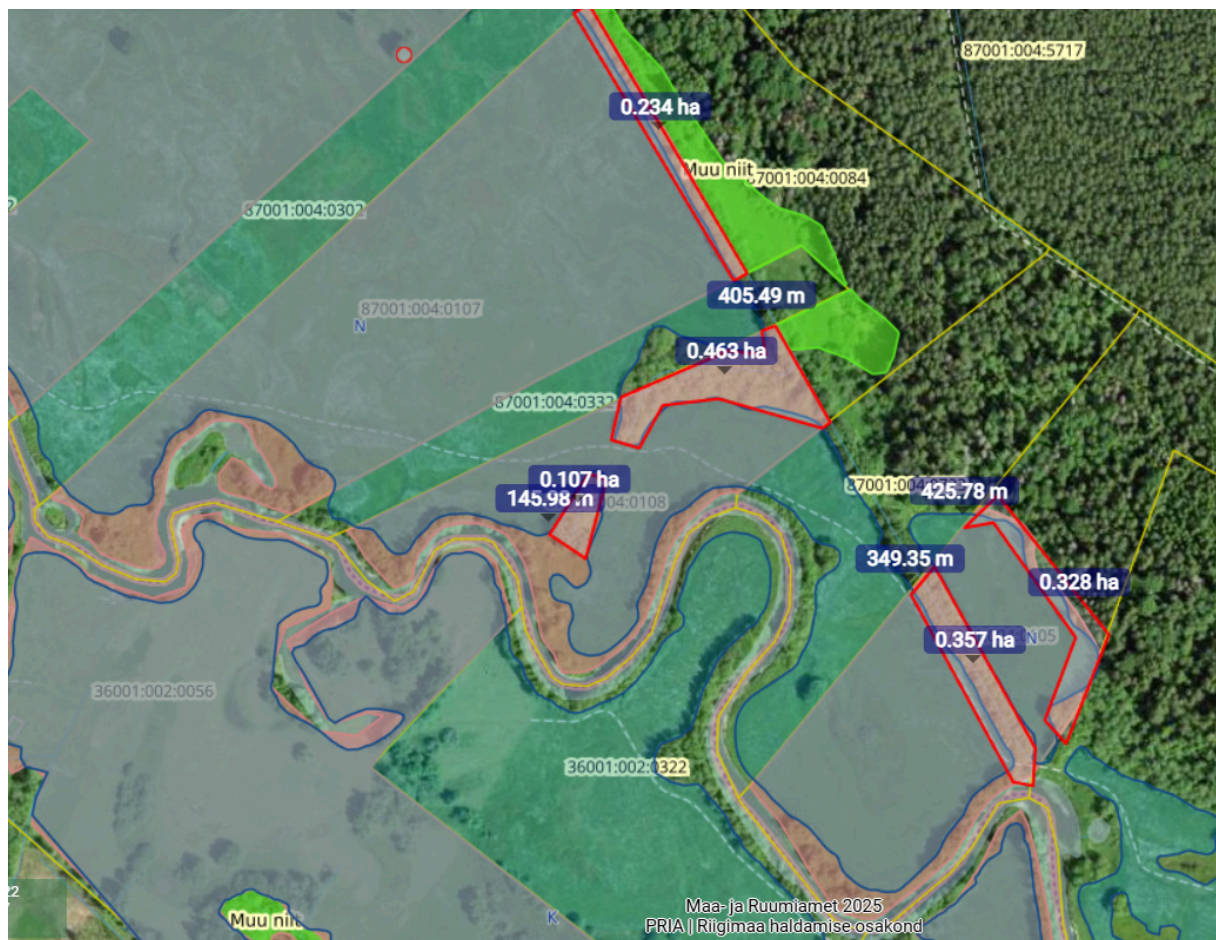
Joonis.2 87001:004:0107, 87001:004:0108, 87001:004:0105 kinnistute taastamine. Pika kraavi äär puhtaks teha. Lisaks alad mis olen sisse märkinud. 87001:004:0105 kinnistul mõlemalt poolt kraavi ära taastada