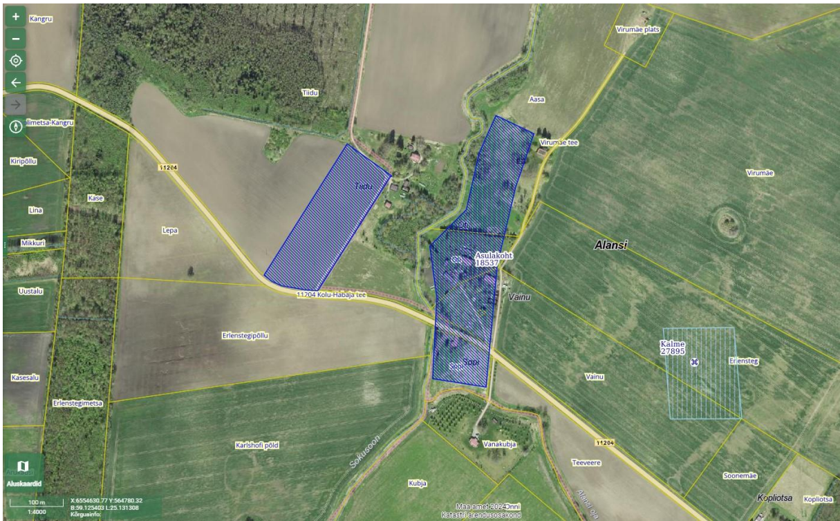
Lisa 1. Asulakoha reg-nr 18537 ning Alansi II asulakoha reg-nr 27591 asukoha kuvad Maa-ameti kultuurimälestiste kaardikihil seisuga 30.08.2024.