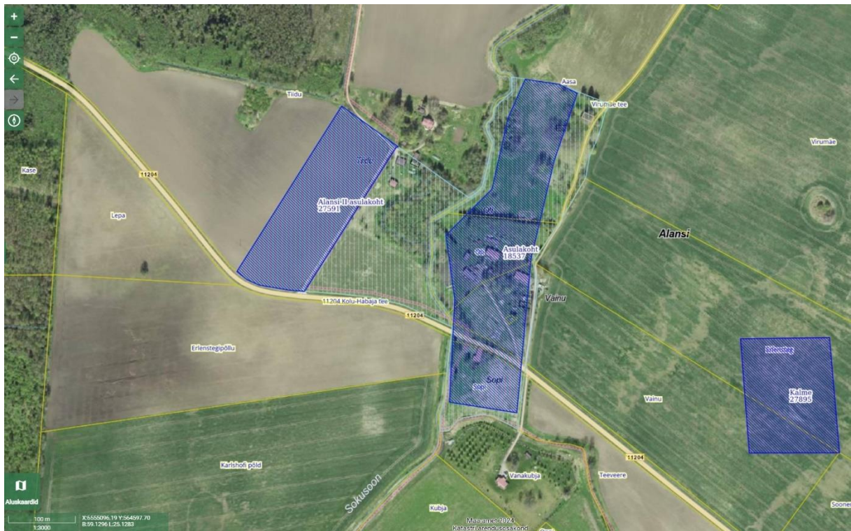
Lisa 3. Asulakoha reg-nr 18537 ning Alansi II asulakoha reg-nr 27591 asukoha ja kaitsevööndi kuvad Maa-ameti kultuurimälestiste kaardikihil seisuga 30.10.2024. (Alus: Maa-ameti geoportaali kultuurimälestiste kaardikiht)