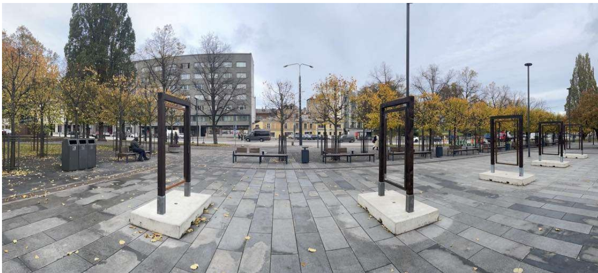
Panoraamvaade Tammsaare pargi Uue turu osa keskeljelt suunaga Estonia teatrist vanalinna poole.

Alapeatükk 2.1 „Tallinn kuulub UNESCO maailmapärandi nimekirja 1997. aastast. Nimekirja pääsemise eelduseks on esitatud paiga erakordne ülemaailmne väärtus (ingl outstanding universal value ehk OUV), mis tähendab objekti kuulumist kõige silmapaistvama kultuuripärandi hulka ülemaailmses mastaabis.”