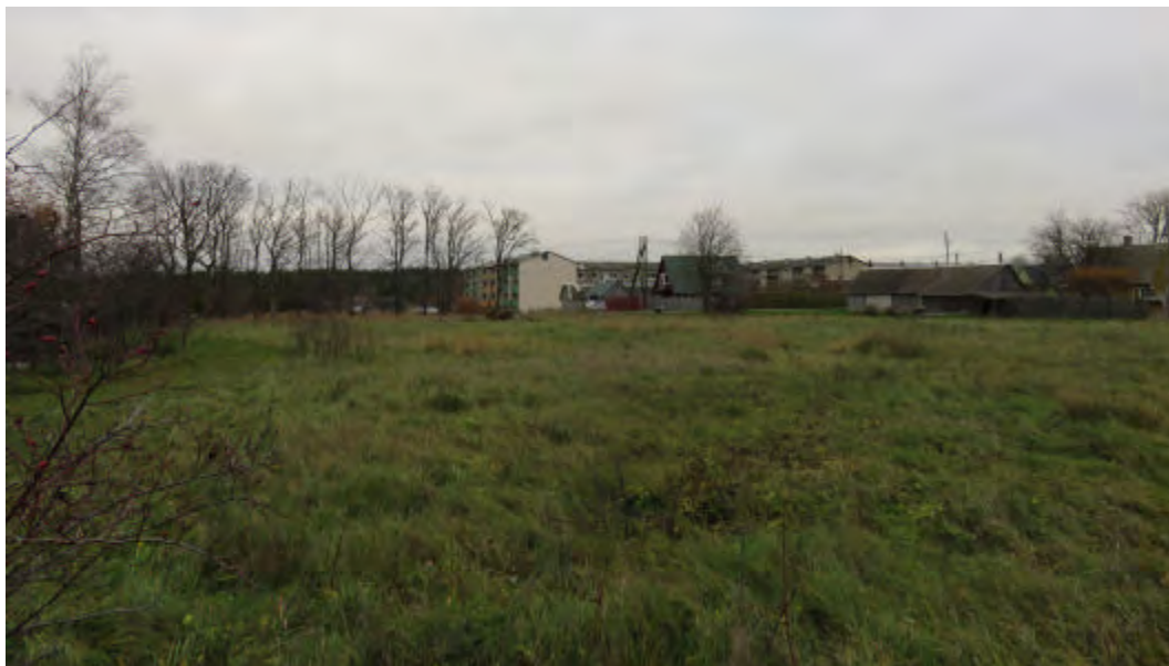
FOTO 4: Vaade Nurmika maaüksusele Ninametsa tee 7 lõuna nurgast ida suunal.