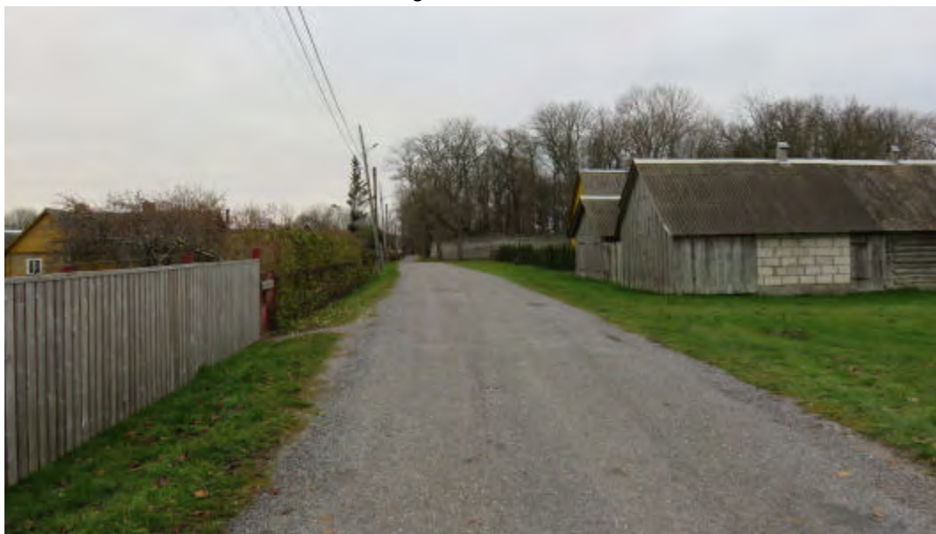
FOTO 6: Vaade Nurmika maaüksuse kõrval olevale Ninametsa teele kagu suunal.