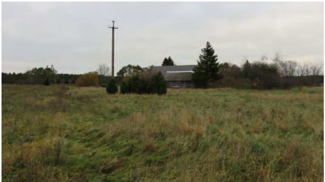
FOTO 3: Vaade Nurmika maaüksusele lääne piiri keskelt põhja suunal.