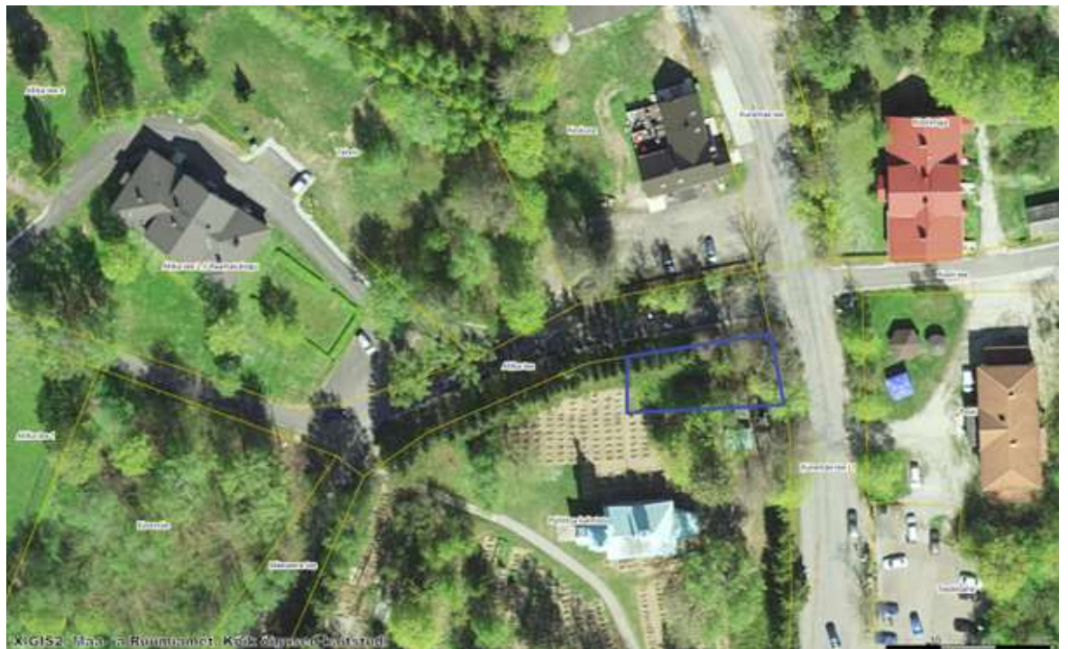
Lisa 2. Uuringuala, märgitud sinise ristkülikuga. Alus: Maa- ja Ruumiamet 2025.