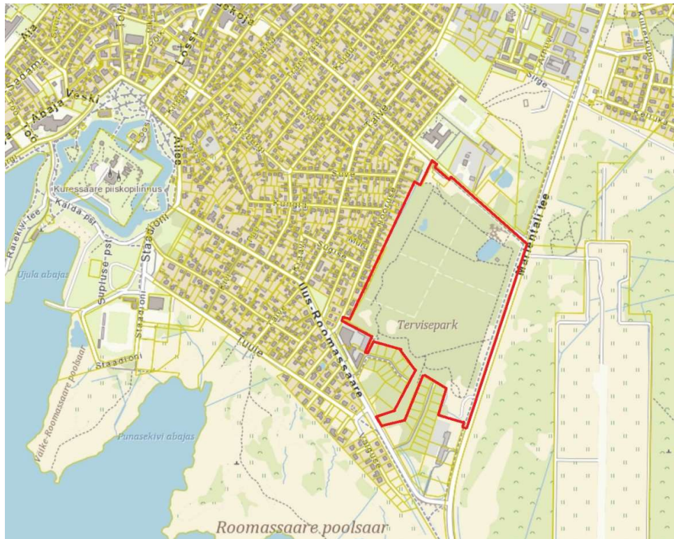
Pilt 1. Väljavõte Maa-ameti geoportaalist. Planeeringuala asukoht on markeeritud punase kontuuriga.

Eeltoodule lisaks on terviseparki 2022ndal aastal ehitatud viihall radade hooldustehnika hoiustamiseks ning konteinerpumppla, 2023ndal aastal on rajatud hooldemeistrite soojak ja turvaed viihalli ümber ning hoone finiši- ja stardialas. Välja on ka ehitatud peasissepääsu parkla.