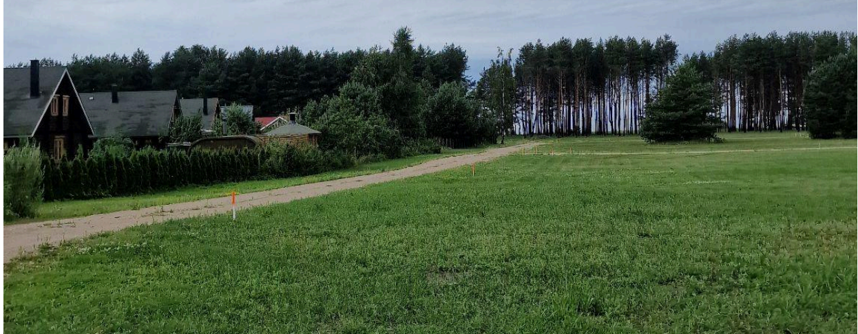
Foto 5. Planeeringuala lõunapoolne tee. (11.07.2024)