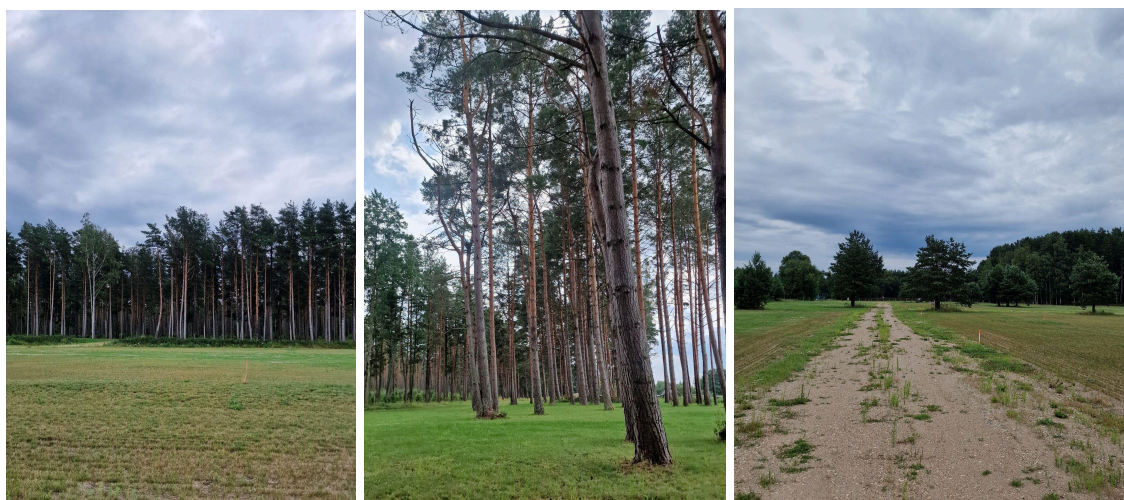
Fotod 1, 2, 3. Olemasolev kõrghaljastus. (11.07.2024)

Osa planeeritavast katastriüksusest moodustab metsamaa, millel valdavaks puuliigiks on harilik mänd (vt foto 1-2). Nooremaid mände leidub ka aladel, mis kõlvikuliselt on määratud kas looduslikuks rohumaks või muuks maaks (vt foto 3).