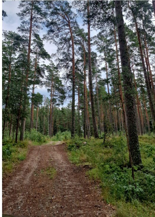
Foto 4. Orajõe metskond 15 metsatee. (11.07.2024)

Juurdepääs riigiteelt (19331 Rannametsa-Ikla tee) planeeringualale on olemas üle Orajõe metskond 15 kinnistu (vt foto 4). RMK valduses olevad teed on riigi omandisse jäetud maal paiknevad valdavalt riigimetsa majandamiseks kasutatavad teed, aga igaüks võib neid teid kasutada, kui riigimetsa majandamist korraldab isik või riigiasutus ei ole teed või selle osa sulgenud või liiklust piiranud. RMK ei ole piiranud Orajõe metskond 15 kinnisasjal olemasoleva metsatee kasutamist.