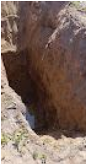
Fotod 1 ja 2. Surfid 1 ja 2, millel on näha geoloogiline läbilõige kuni paeni.

Keskkonnaandmebaasi EELIS andmetel lähiümbruse kinnistutel puurkaevusid ei ole. Mõisa tee 27 kinnistu ja selle lähiümbrus paiknevad vastavalt eespooltoodule kaitsmata põhjaveega alal (vt kaart 4).