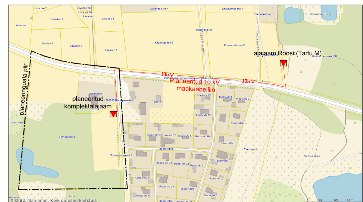
SKEEM 1. Planeeritud elektritoite põhimõtteline skeem väljaspool planeeringuala.