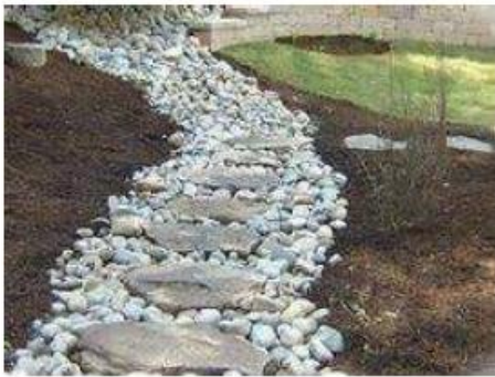
Foto 3. Täidisdrenaaž tüüp 2