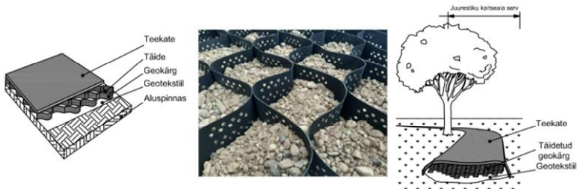
Joonis 8.1 — Geokärje kasutamine

Kaevevabalt katendi rajamise võimaluse annab näiteks koormuse hajutamise kihina kolmemõõtmelise polüetüleenist geokärje (ingl Cellular Confinement System) kasutamine (vt joonis 8.1). Seda spetsiaalset, paindliku lõtsana lahtitõmmatavat materjali kasutatakse peamiselt küll nolvade kindlustamisel, kuid seda on hea kasutada ka kergliiklusteede ja siduautode parklate ehitamiseks. Kaevevabalt katendi rajamiseks eemaldatakse muru või mätkakiht juurtelt ettevaatlikult, juuri võimalikult vähe vigastades. Juuri ja juurte vahel olevat kasvupinnast ei eemaldata. Katendi rajamise ja materjalide kohta vt lisa B. Võimalike külmakergetest tingitud kahjustuste vältimiseks ei soovitata seda katendit katta jäiga materjaliga (nt betoonkivid), vaid materjaliga, mis külmakergetele n-ö kaasa mängib (nt kruus, killustik).