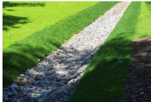
Foto 4. Täidisdrenaaž tüüp 3

Pinnavee valgumise kiirendamiseks maapinnalt suuremate sadude ja kevadise sula ajal on täidisdrenaažile ettenähtud kuppelrestkaevude paigaldamine (vt foto 5).