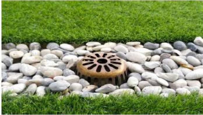
Foto 5. Kuppelrestkaevu näidis.

Täpsemat infot saab vaadata eriprojektis (Inseneribüroo Urmas Nugin OÜ, Sillaotsa Talumuuseumi õueala kuivendamine, töö nr. 2024035).