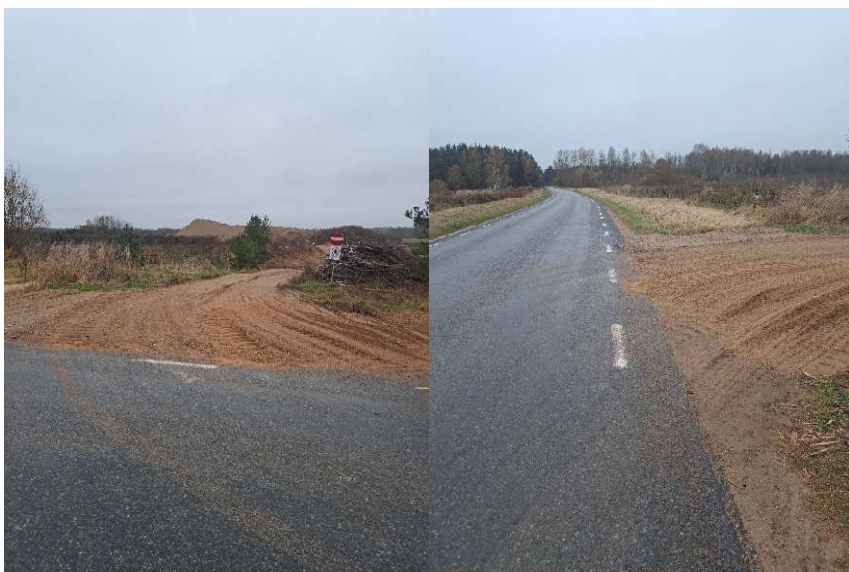
Fotod 1 ja 2 , Vaated „Jaani“ kruusakarjääriga ristumisele