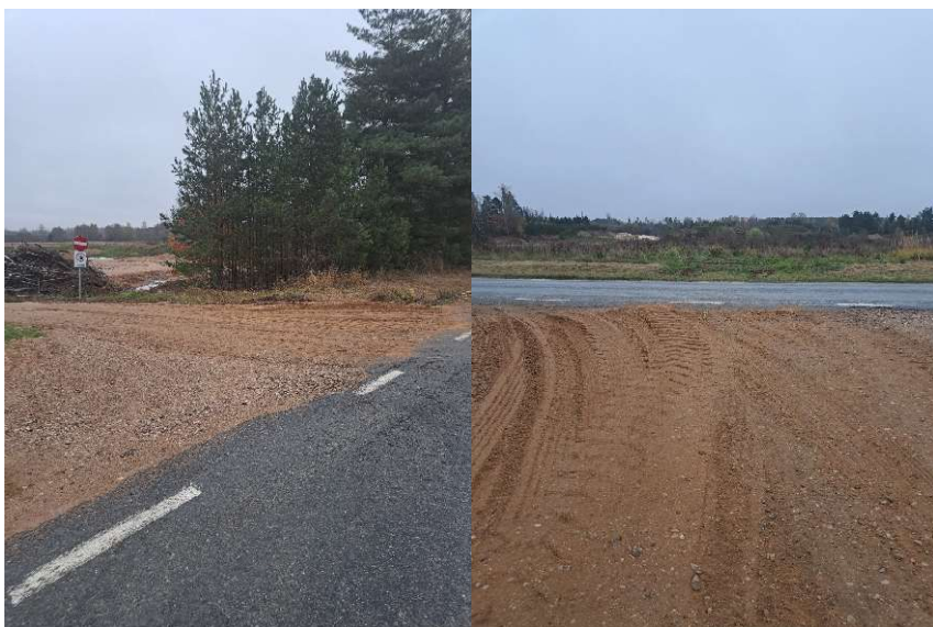
Fotod 3 ja 4 , Vaated „Jaani“ kruusakarjääriga ristumisele