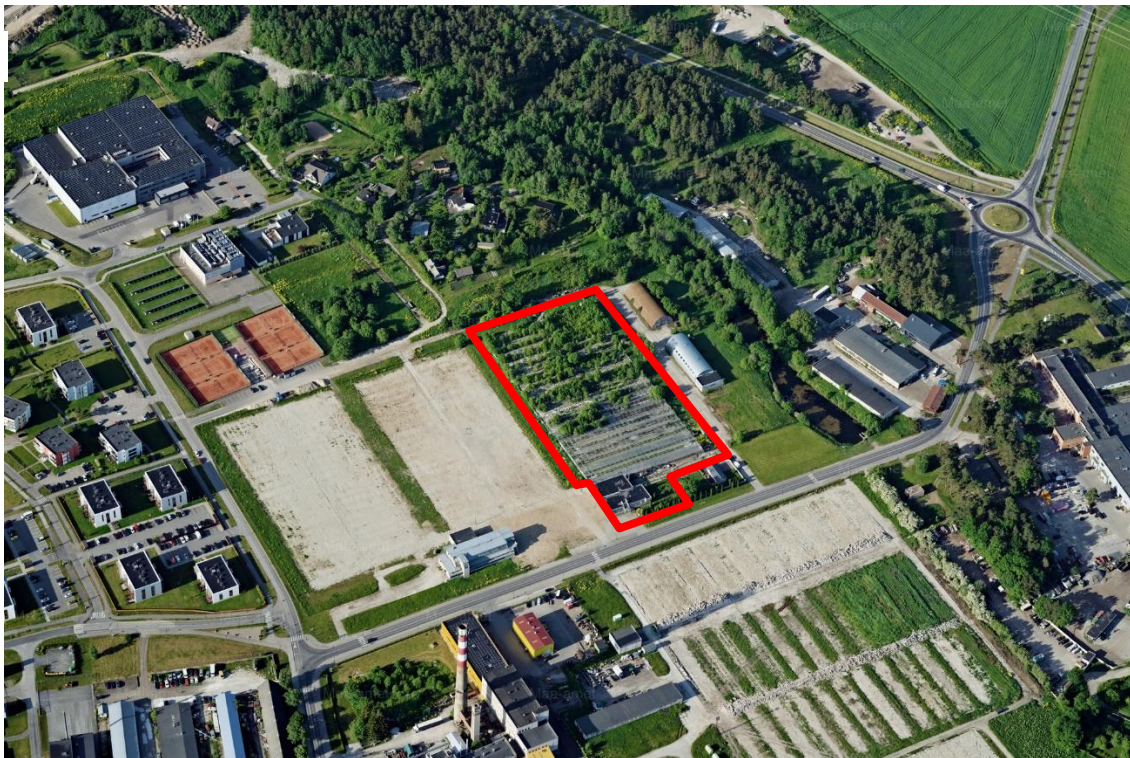
Maa-amet kaldaerofoto 17.06.2022