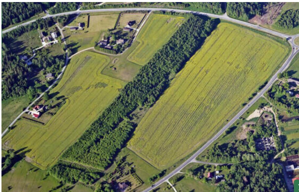
Miku-Jüri planeeringuala – metsatukk rapsipõldude vahel. Vaade Rapla suunast, paremal ülانurgas Märjamaa tee ja Rapla ringtee ristmik

seoses Miku-Jüri kinnistu algatatud detailplaneeringuga (Tuti küla, Rapla vald)