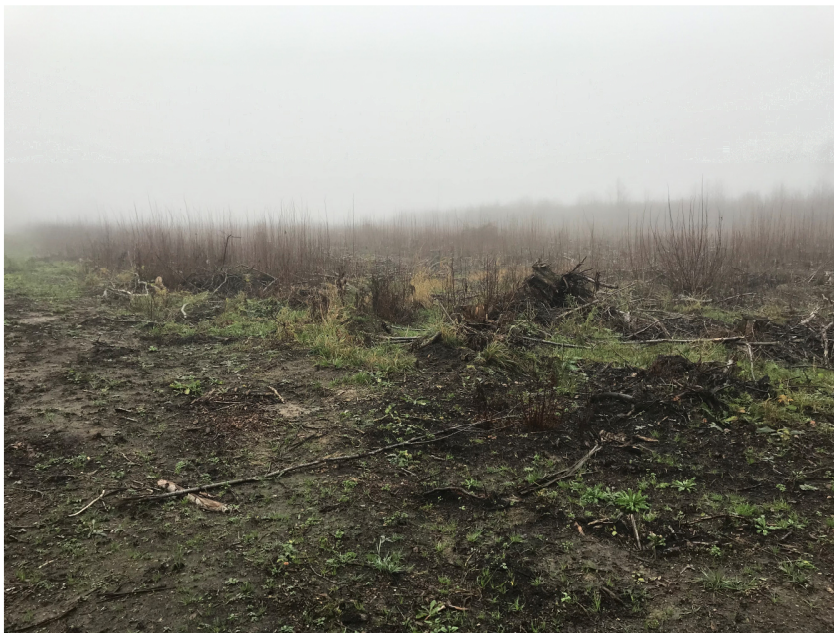
Foto planeeritud alale juurdepääsutee asukohast.

Planeeringualast paremale poole (ida suunda) on projekteerimisel Tallinn-Pärnu-Ikla (Via Baltica) maantee koos kahetasandilise ristmikuga mis on kantud ka käesoleva detailplaneeringu põhijoonisele ja mis on ka käesoleva detailplaneeringu koostamise alus. Selle taha on ette nähtud rajada kehtiva detailplaneeringu alusel Via Balticat kasutavate autode teenindus ja puhkeala koos elektriautode laadimisjaamaga ning käesoleva detailplaneeringu eesmärgiks ongi tagada selle laadimisjaama varustamine roheenergiaga mis saadakse käesoleva detailplaneeringuga kavandatud päikesepaneelide pargist. Käesoleva planeeringuga ei ole ette nähtud täiendavate puude likvideerimist ning on jäetud ka piisav puhverala rajatava maantee ning planeeritud päikesepargi vahelisele alale.