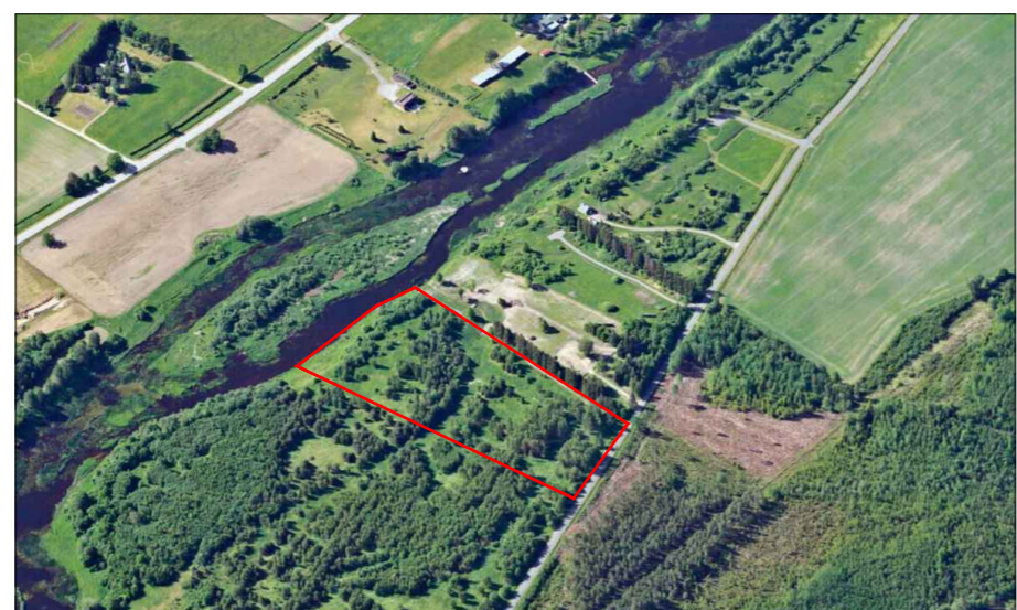
Pildistatud 09.06.2023.

Märkused: *Detailplaneeringu alusplaaniks on Geodeesia24 OÜ (Litsentsid: 751 MA, EE6000265, Reg nr: 12135099) poolt 14.06.2023 koostatud geodeetiline alusplaan määtkavas 1:500 (töö nr 7771-23). Koordinaadid L-EST197 süsteemis. Kõrgused EH2000 süsteemis. *Detailplaneeringu ala suurus on 36846 m². *Detailplaneeringu jooniste lahutamatu osa on seletuskiri. *Maaparandussüsteem on riiklikust registrist maha võetud.