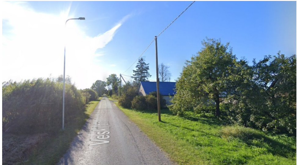
Vaade Veski tänavale