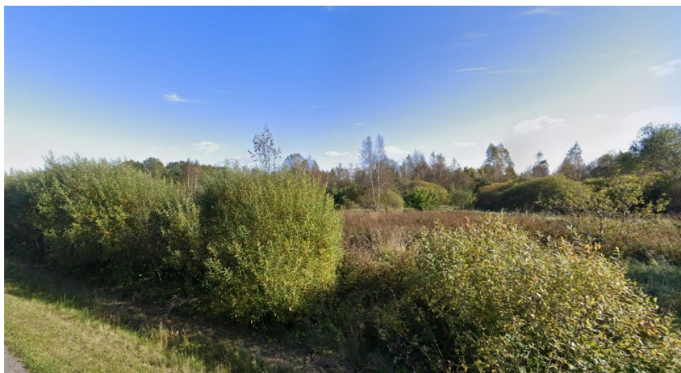
Vaade Veski tn. 10 kinnistule