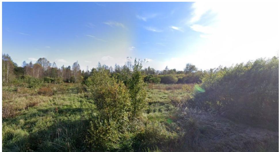
Vaade Veski tn. 10 kinnistule

Fotod olemasolevast olukorrast, fotod Google maps rakendusest