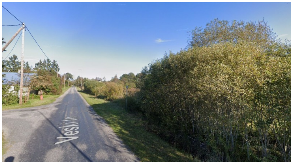
Vaade Veski tn. Ja Allika tn. nurgalt