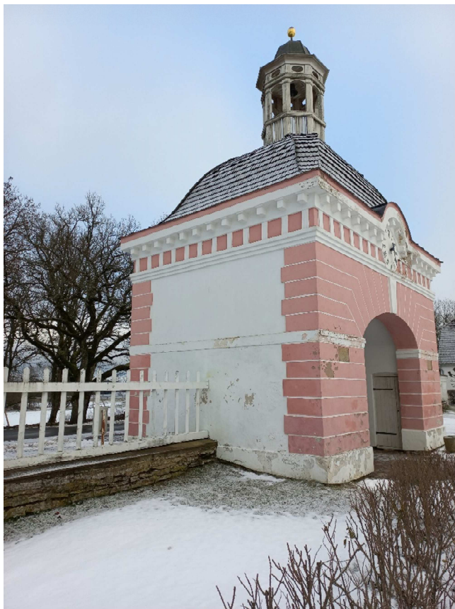
Foto 9. Väravahoone läänepoolne fassaad.