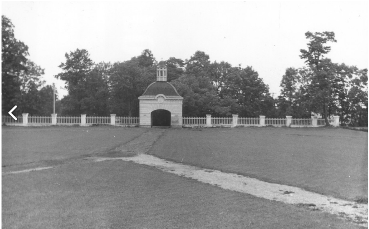
Foto 5. Väravahoone 1984. aastal.