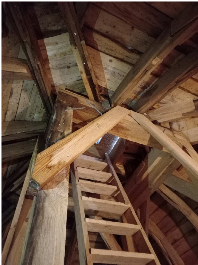
Fotod 11–13. Katusekonstruktsioon.