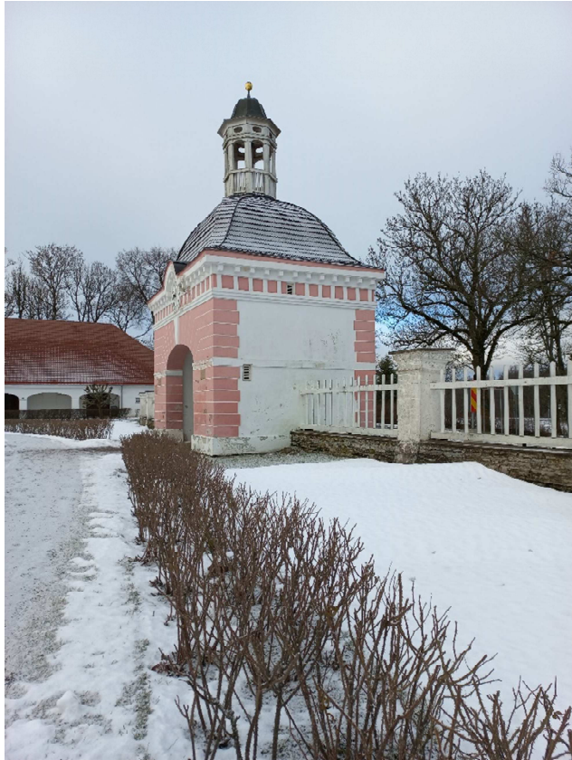
Foto 8. Väravahoone idapoolne fassaad.