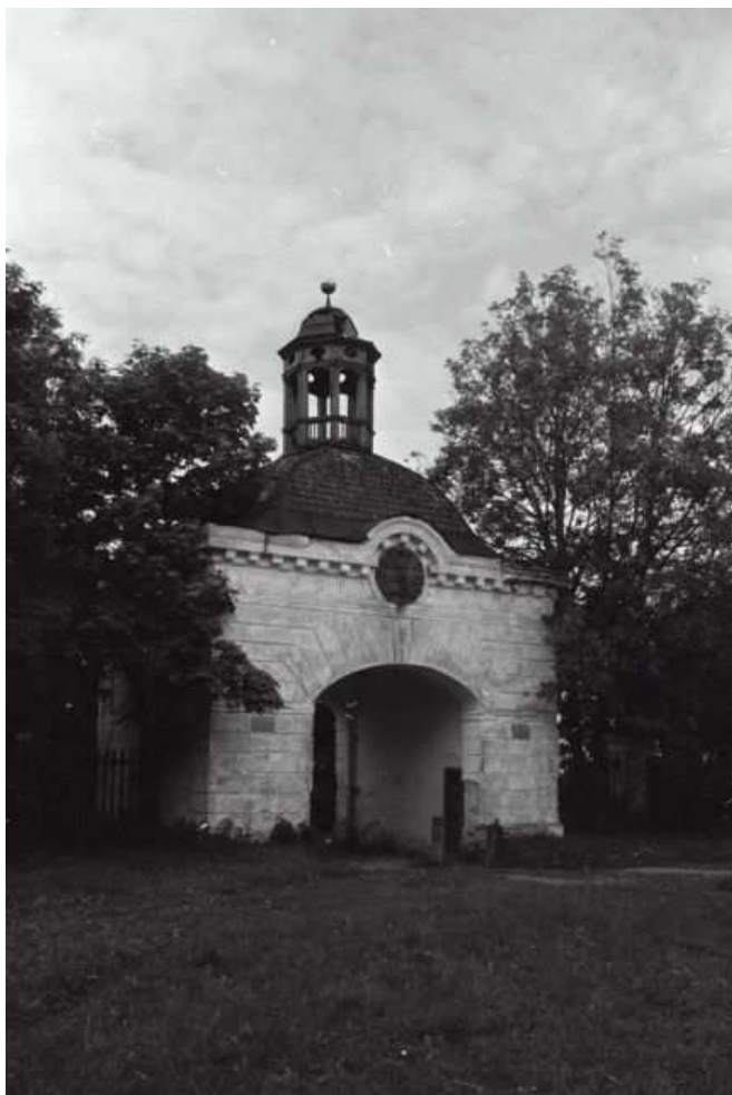
Foto 3. Väravahoone 1964. aastal.