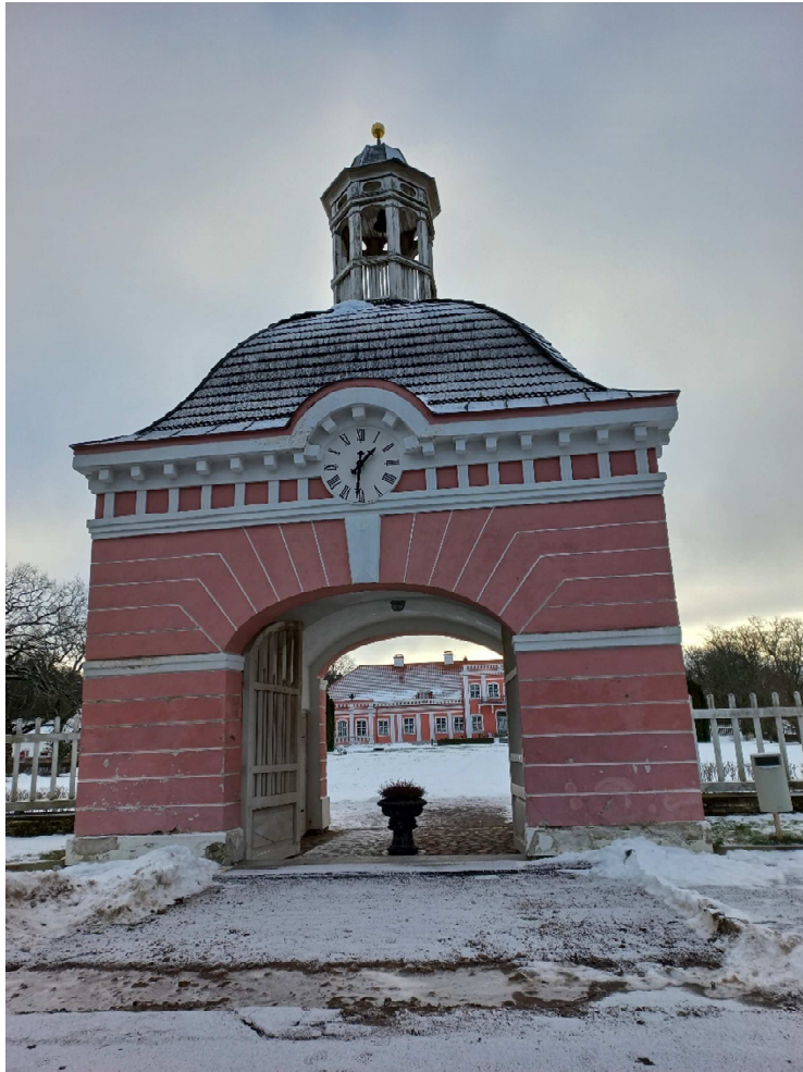
Foto 6. Väravahoone põhjapoolne fassaad.