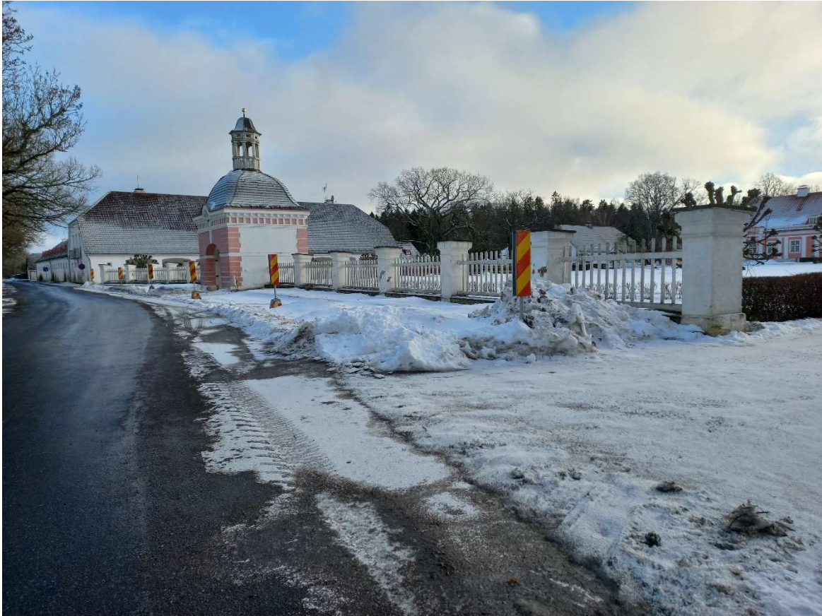
Foto 10. Väravahoone ja piirdeaed loode suunalt.