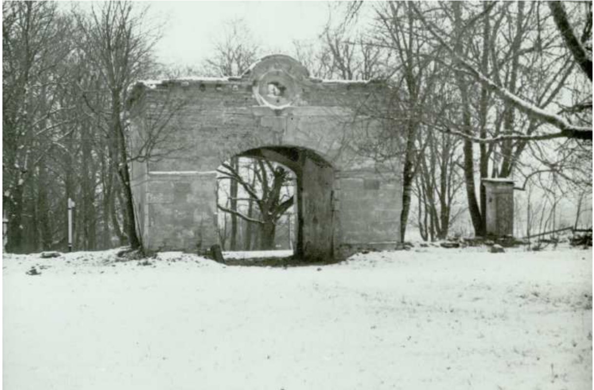
Foto 4. Väravahoone u 1977.