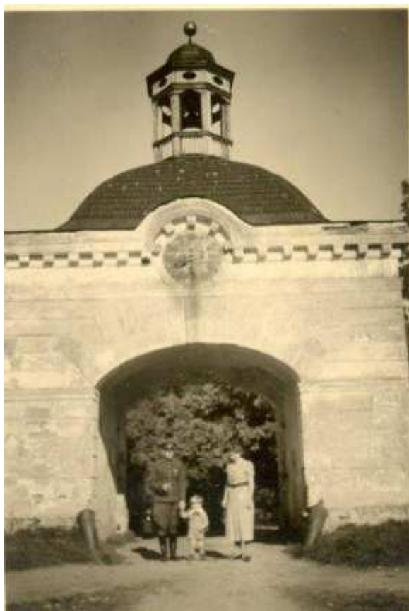
Foto 1. Väravahoone u 20. sajandi algul.