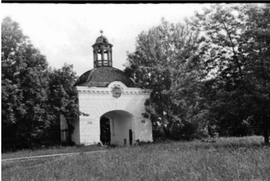
Foto 2. Väravahoone 1960. aastal.