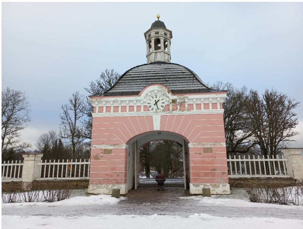
Foto 7. Väravahoone lõunapoolne fassaad.