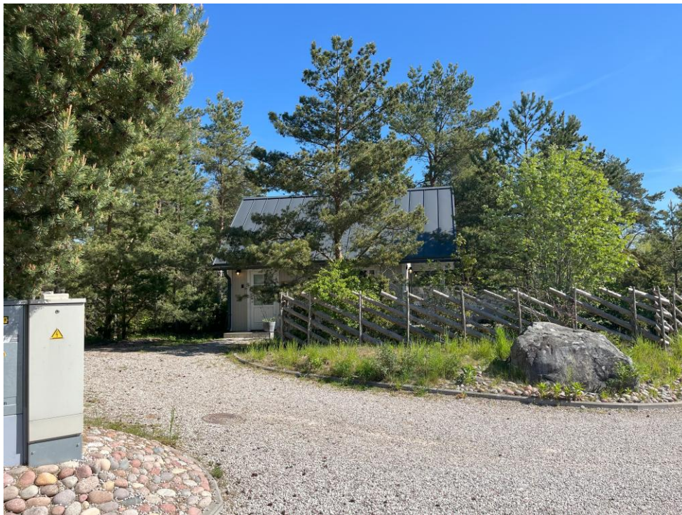
Foto 2 Näide olemasolevast kiviaiast.