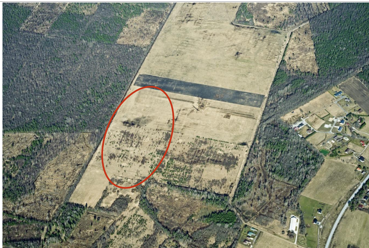
Vaade planeeritavale alale (aerofoto)

Planeeringuala suurus kokku on ca 4.3 ha. Planeeringuala puudutab 5 kinnistut, kus põhirõhk on Metsataguse ja Sõerumaa-Veski kinnistutel. Kinnistud on hoonestamata.