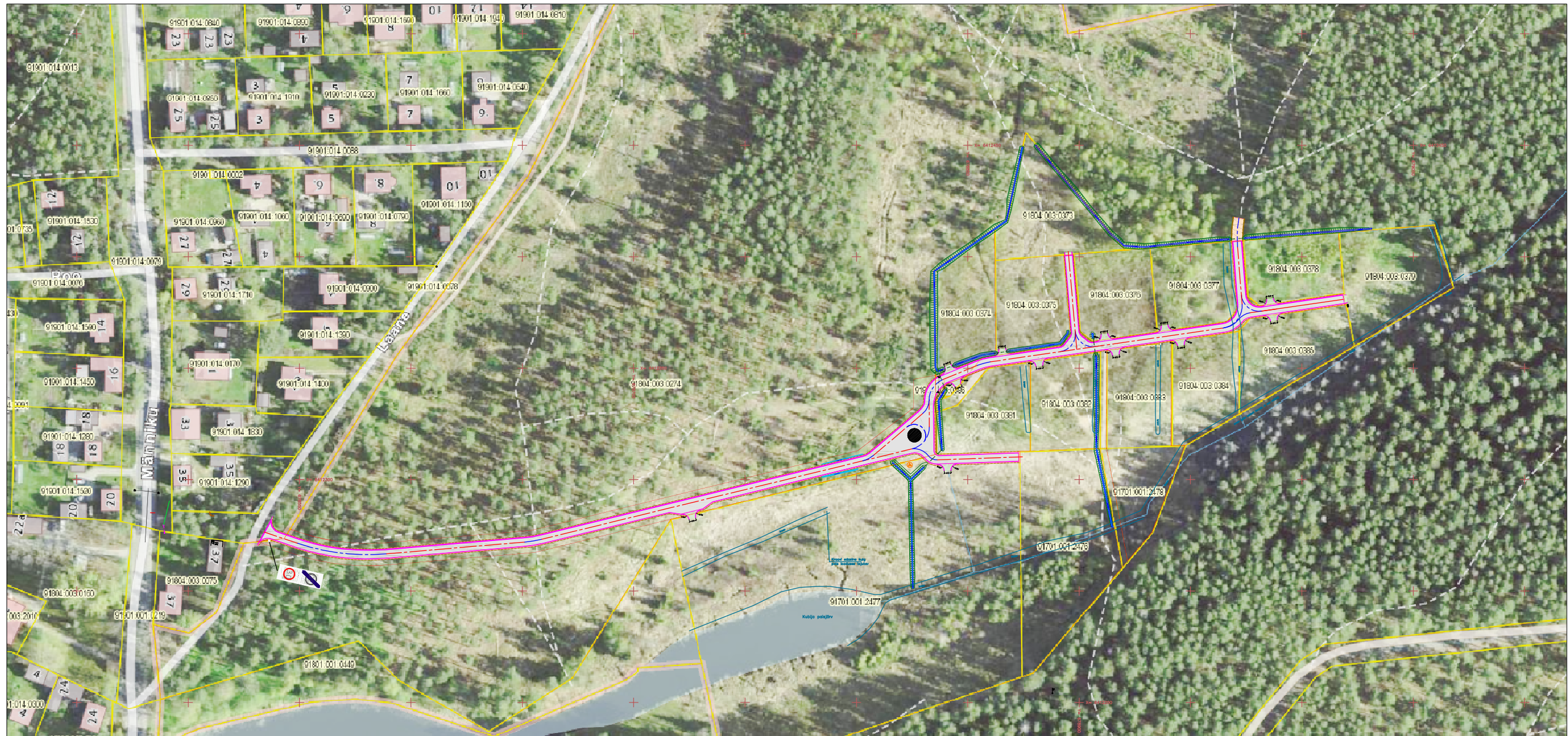
ASUKOHT MAA-AMETI ORTOFOTOL M 1:2000