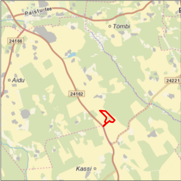
Kaardileht nr 5342 (Viljandi)