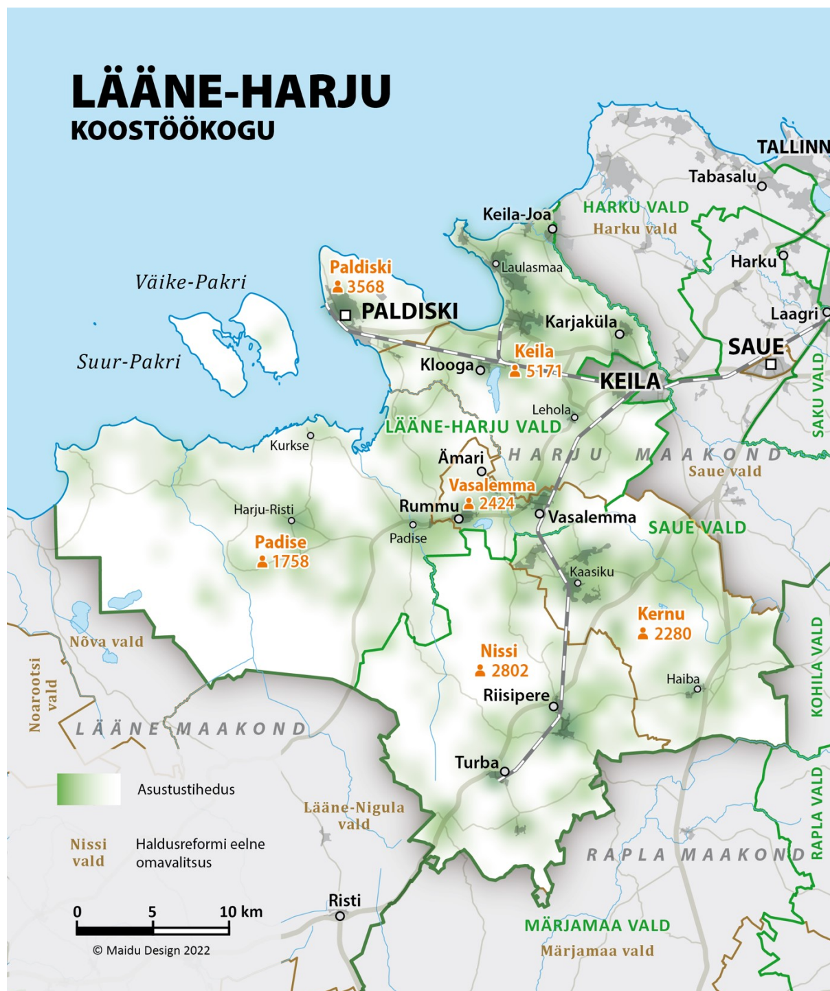
Joonis 1. Lääne-Harju Koostöökogu tegevuspiirkond (2022. a andmed)

LHKK tegevuspiirkond asub Loode-Eestis Harjumaal, hõlmates kahe omavalitsuse territooriume (Joonis 1). Lääne-Harju vald kuulub tegevuspiirkonda tervikuna, Saue vald osaliselt (2017. a haldusreformieelsed Kernu ja Nissi vallad).