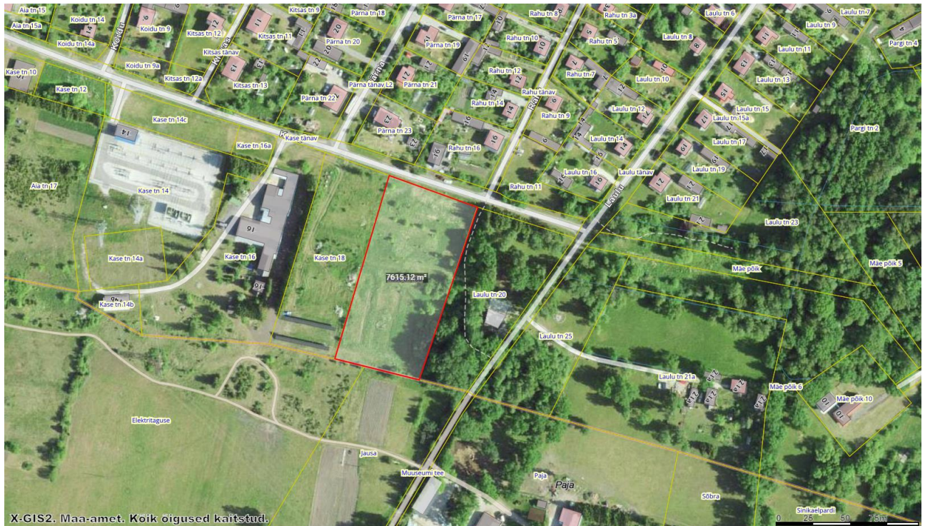
Joonis 1. Planeeringuala asendiskeem

Planeeringuala asub Orissaare aleviku lõunapoolses osas Kase tänaval.