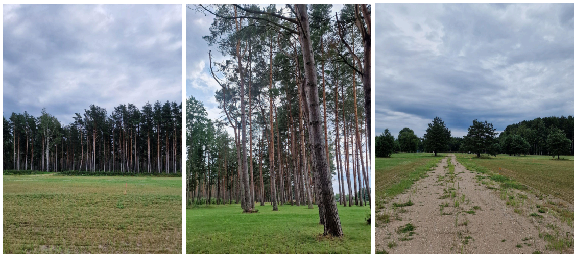
Fotod 1, 2, 3. Olemasolev kõrghaljastus. (11.07.2024)

Osa planeeritavast katastriüksusest moodustab metsamaa, millel valdavaks puuliigiks on harilik mänd (vt foto 1-2). Nooremaid mände leidub ka aladel, mis kõlvikuliselt on määratud kas looduslikuks rohumaks või muuks maaks (vt foto 3).