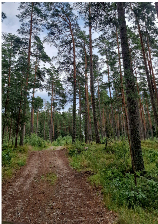
Foto 4. Orajõe metskond 15 metsatee. (11.07.2024)

Juurdepääs riigiteelt (19331 Rannametsa-Ikla tee) planeeringualale on olemas üle Orajõe metskond 15 kinnistu (vt foto 4). RMK valduses olevad teed on riigi omandisse jäetud maal paiknevad valdavalt riigimetsa majandamiseks kasutatavad teed, aga igaüks võib neid teid kasutada, kui riigimetsa majandamist korraldab isik või riigiasutus ei ole teed või selle osa sulgenud või liiklust piiranud. RMK ei ole piiranud Orajõe metskond 15 kinnisasjal olemasoleva metsatee kasutamist.