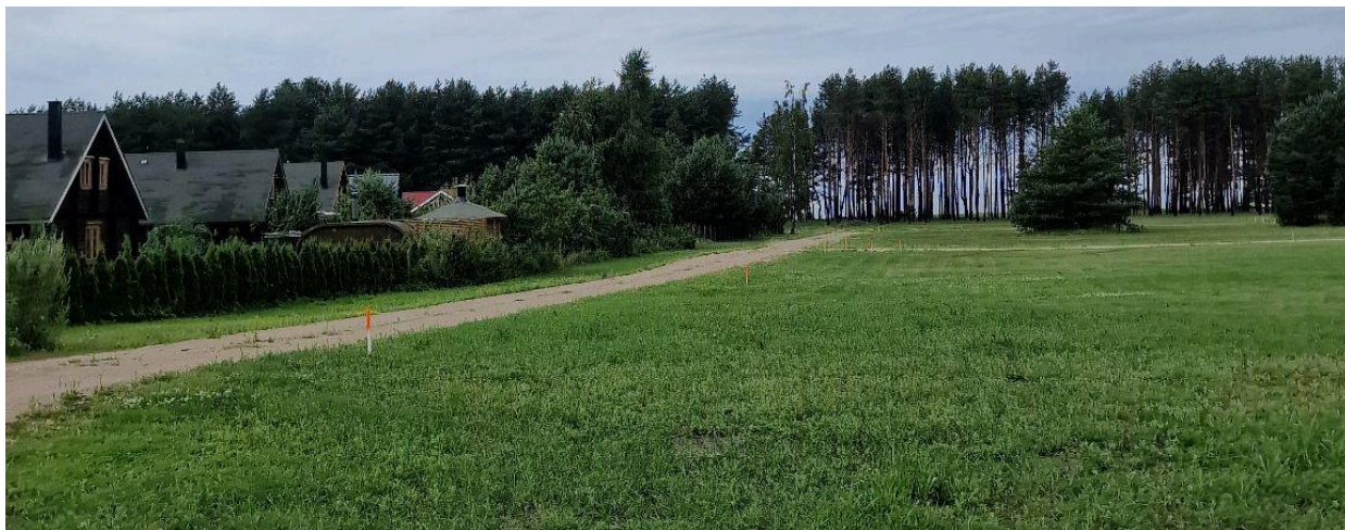
Foto 5. Planeeringuala lõunapoolne tee, mis kulgeb kallasrajale viiva juurdepääsuni. (11.07.2024)