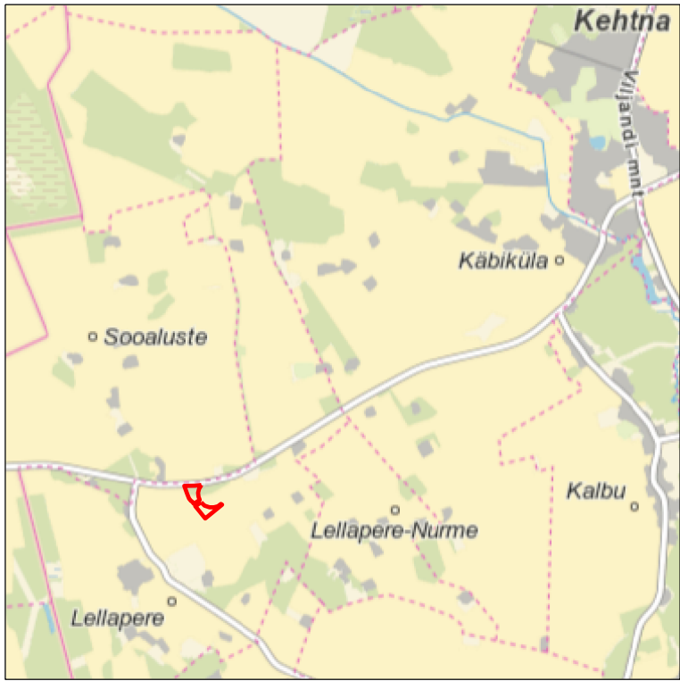
Kaardilehed nr 6314 Rapla ja 6323 Kaiu