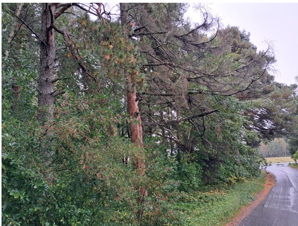
Foto 1. Ristipuu (mänd) Männi tänava ääres.