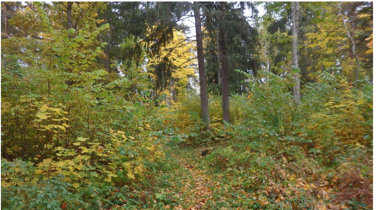
Foto 2. Parkmetsa läbiva jalgtee ääres raiutud ristipuu (kuusk) känd. 13.10.2025.