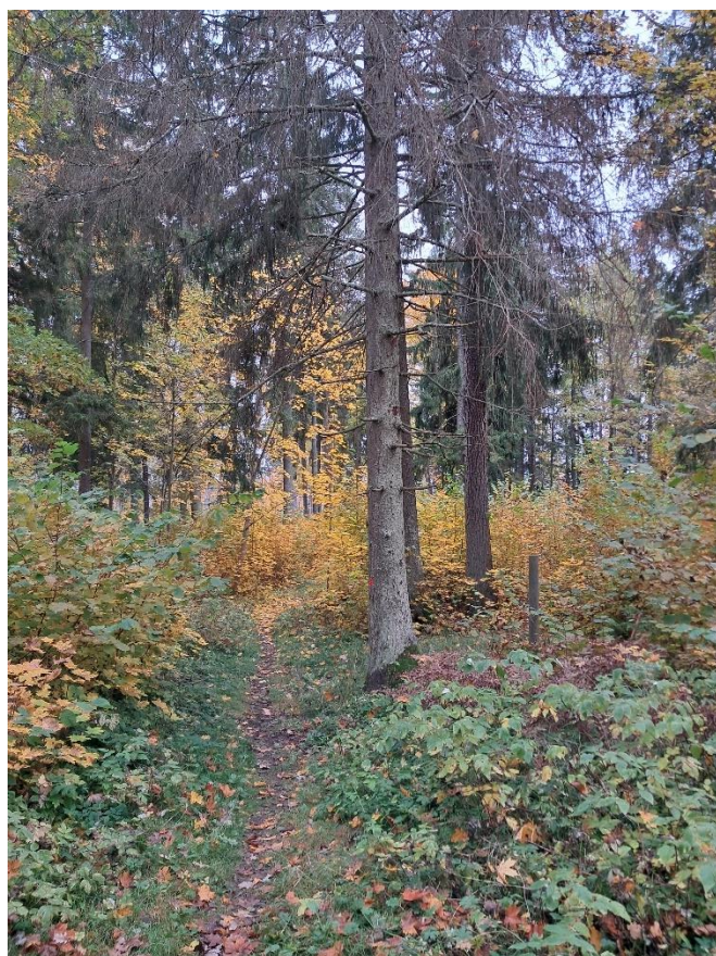
Foto 2. Ristipuu (kuusk) parkmetsa läbiva jalgtees ääres. 14.10.2024