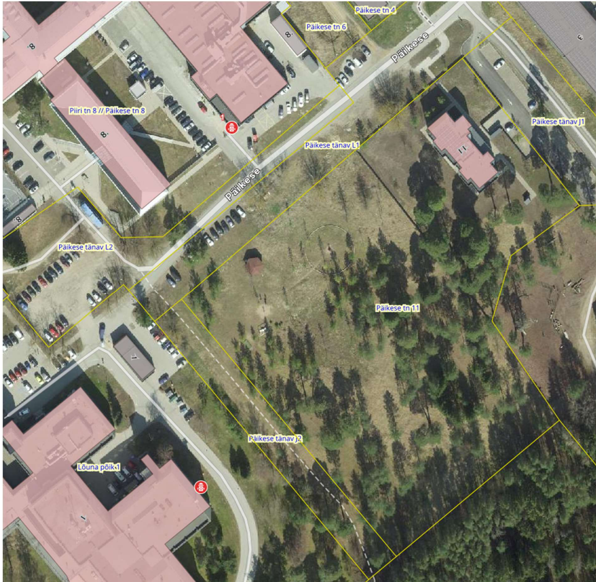
Joonis 2 Väljavõte Maa- ja Ruumiameeti Geoportaali kaardirakendustest Ohtlikud käitised, veevarustus, veeohutus