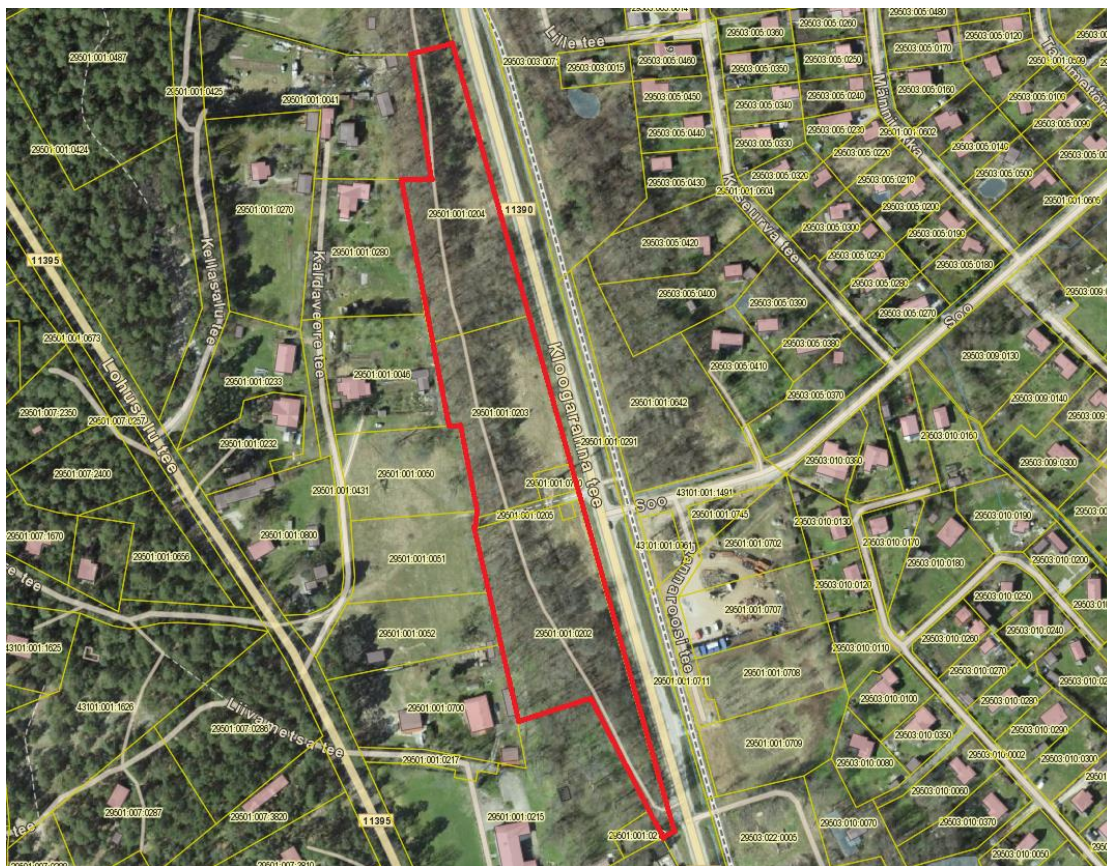
Skeem 2 – Objekti asukoht (2).