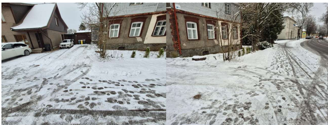
Fotod 5 ja 6 . Vaade Tartu tn ümber ühendamise ja veemöödukaevu paigaldamise positsioonile

AS TREV-2 Grupp Reg. nr. 10047362 KMKR: EE100280335 02.12.2025