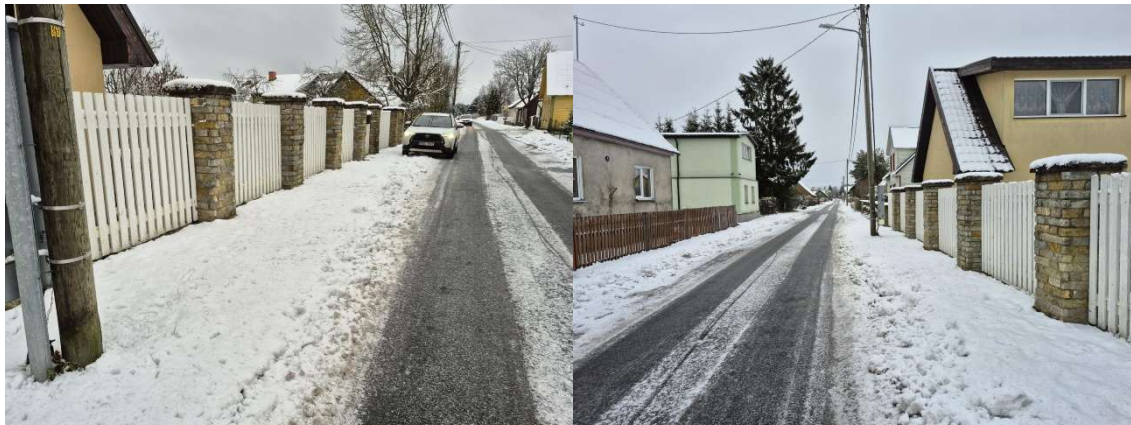
Fotod 1 ja 2 , Vaade Pihkva 36 maakraani paigaldamise positsioonile