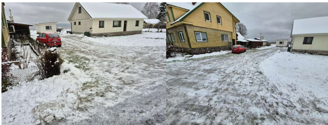
Fotod 7 ja 8. Vaade Narva tn veemöödukaevu paigaldamise positsioonile