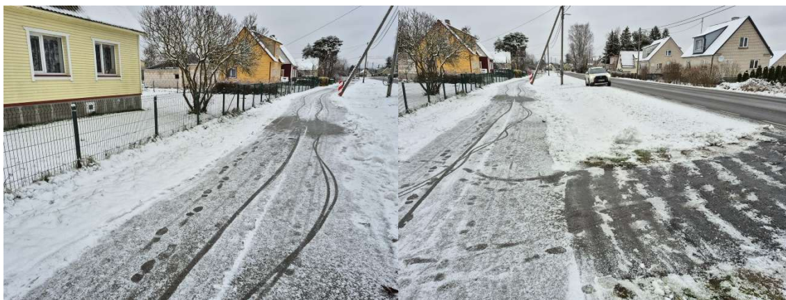
Fotod 3 ja 4 . Vaade Aia tänava paigaldatavate maakraanide positsioonidele