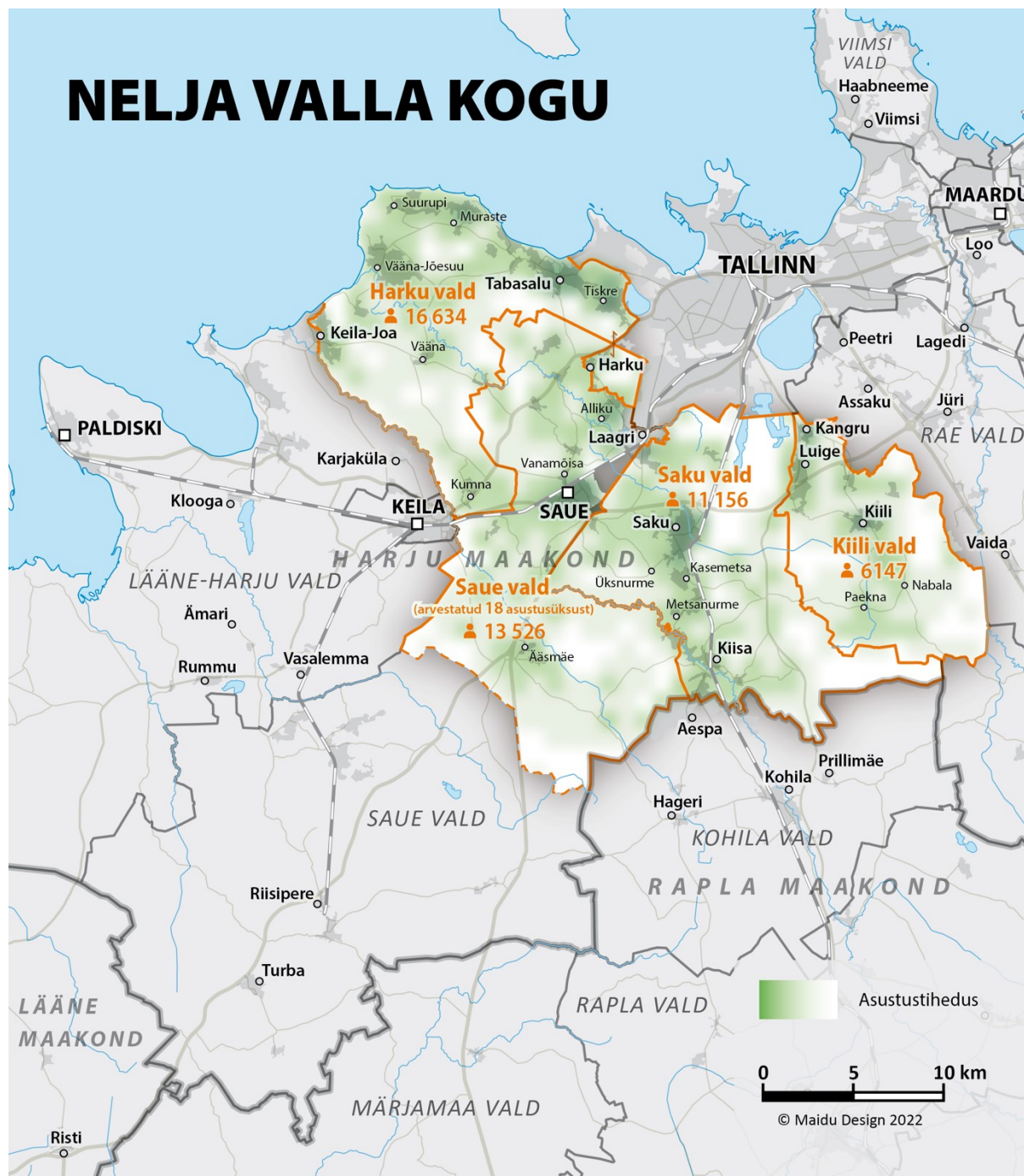
Joonis 1. NVK tegevuspiirkonna kaart

Tegevuspiirkond (623,6 km 2 ) asub Harjumaa (4328 km 2 ) lääne-, edela- ja lõunaosas, piirnedes Tallinna linnaga. Piirkond hõlmab nelja kohaliku omavalitsuse territooriumeid – Harku, Kiili, Saue ja Saku, sh Harku, Saku ja Kiili valda tervikuna, Saue valla endise Saue linna ja Saue valla ala (v.a Laagri alevik ning endise Kernu ja Nissi valla külad), moodustades Harjumaa 14,4% (Joonis 1).