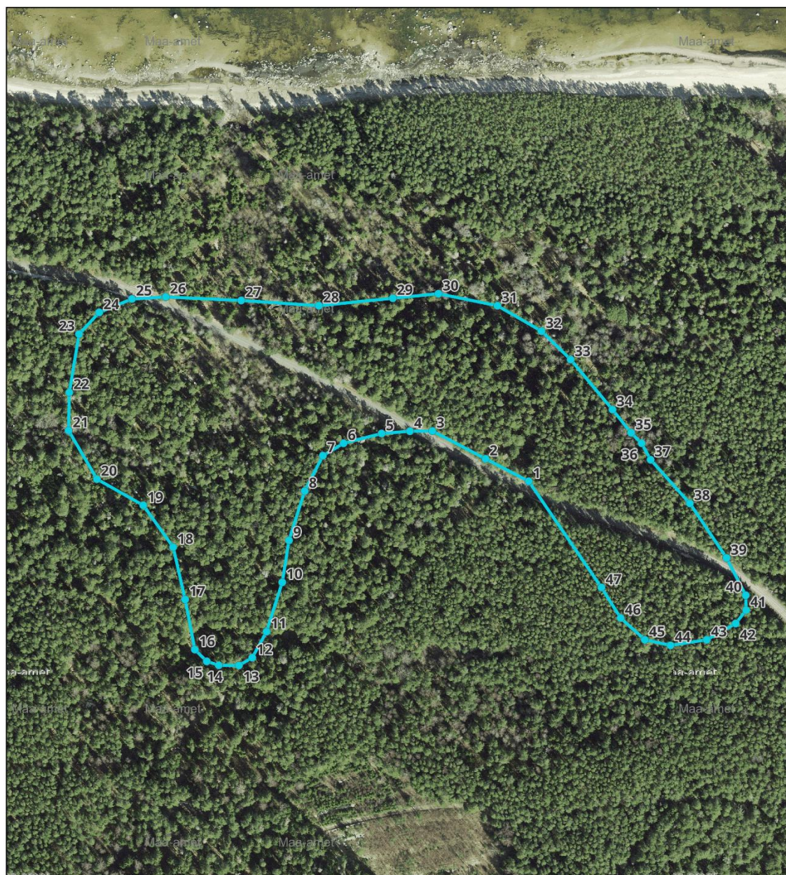
Kaart 1. Arheoloogilise leiukoha piir.