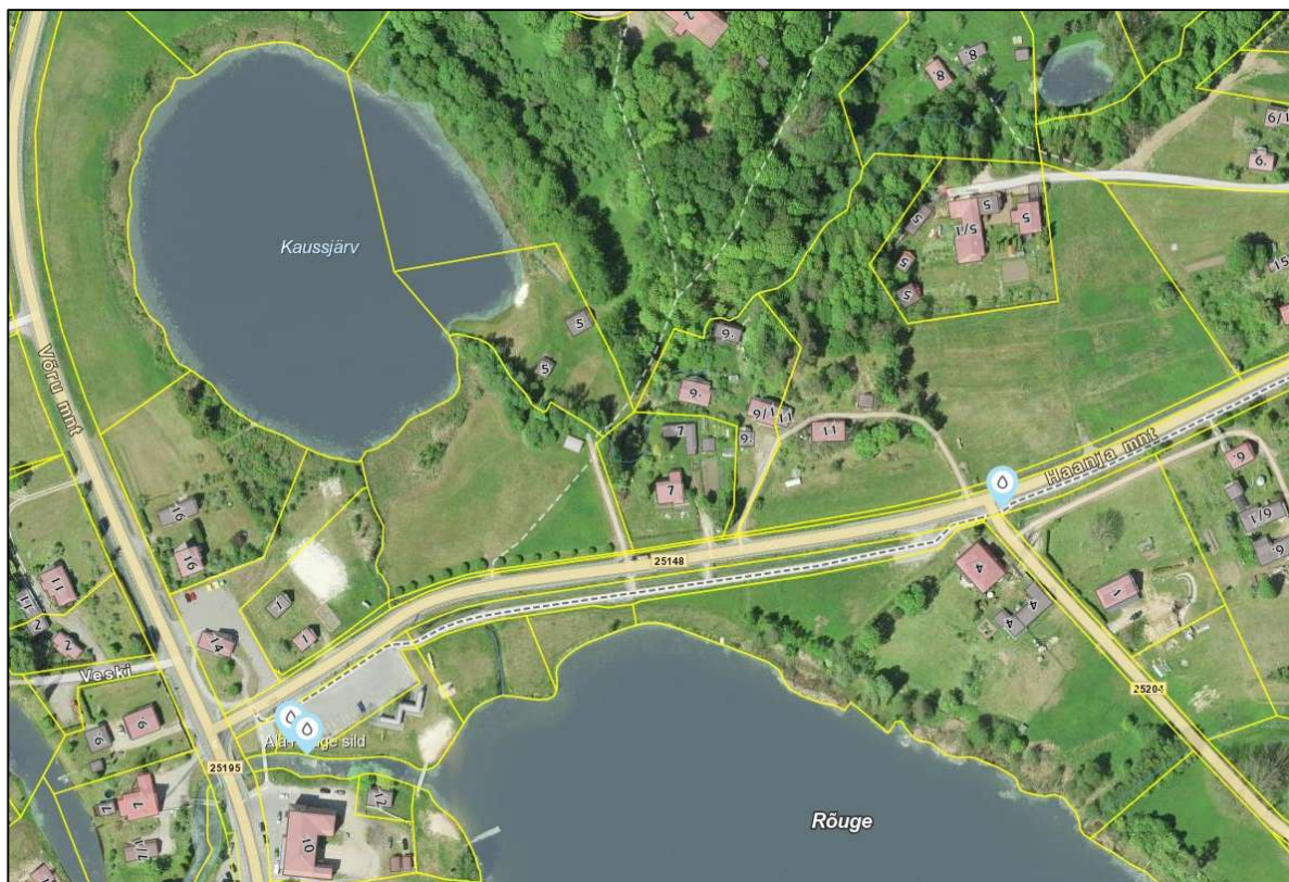
Joonis 2 Väljavõte Maa- ja Ruumiameti E-ehituse portaalist