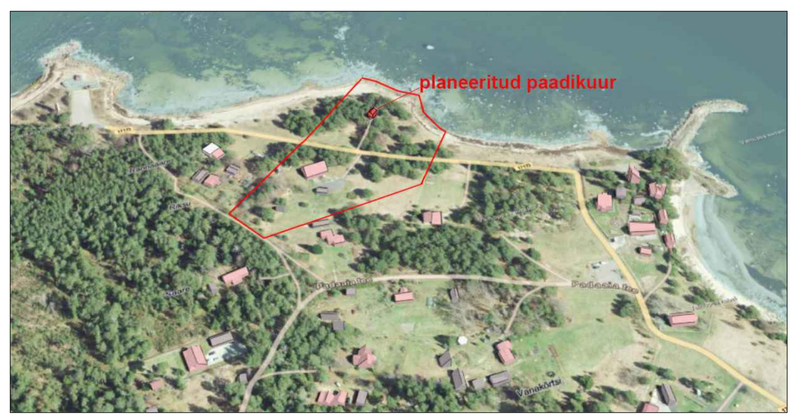
Illustreeriv vaade, alusena kasutatud Maa-ameti 3D kaarti (21.09.2023)

MHV Consult OÜ Vabaduse 5-52 Räävere 44308 reg. nr 11292477 tel: +372 52 11 425 email: info@mhv.ee