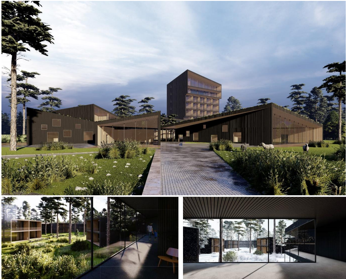
Joonis 1: Loodusesse hajutatud väikesemahulised moodulid

Looduspaahotelli ümbritsev looduskeskkond loob unikaalse võimaluse müüa „nelja aastaaga“, mis võimaldab teistest eristuda ning pakkuda vaheldusrikast ja unikaalset elamuskogemust igal aastaajal.