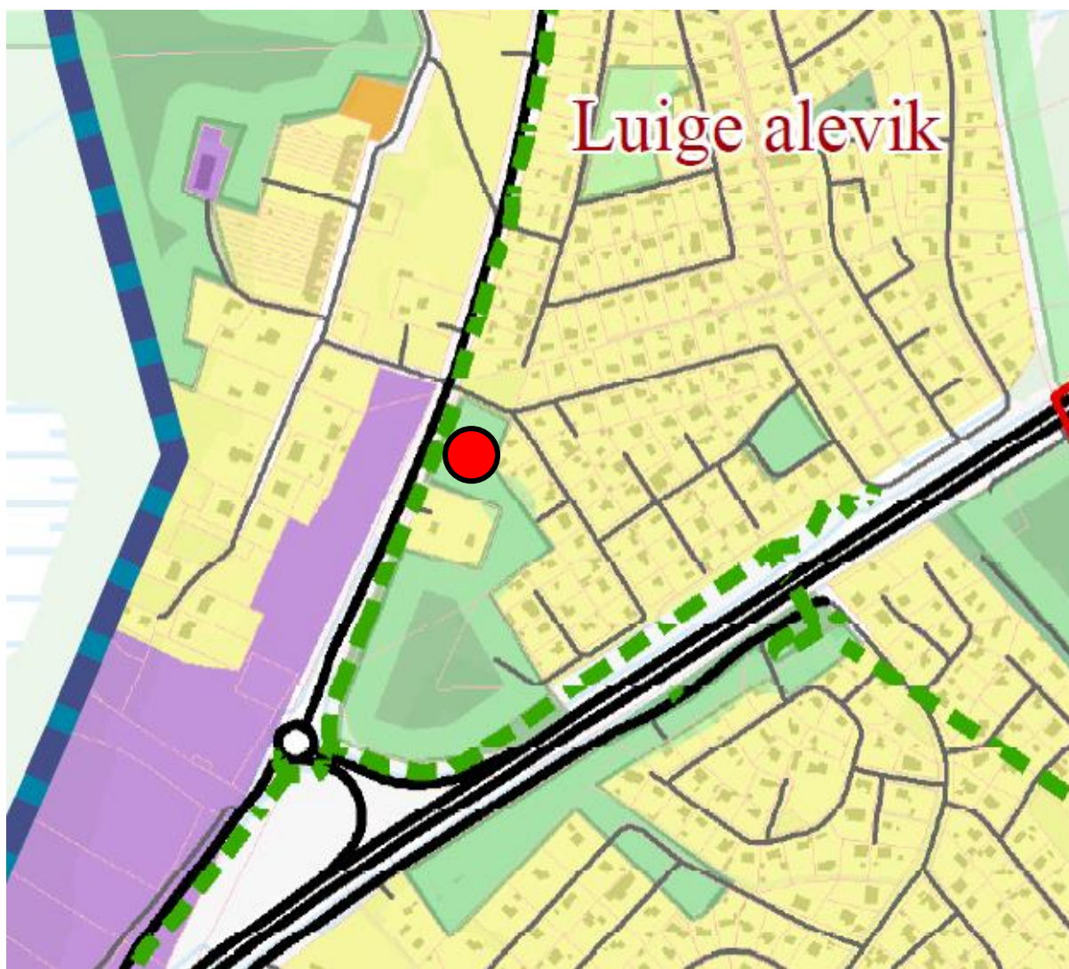
Joonis 2: Väljavõte koostatavast Kiili valla üldplaneeringust

Puhke ja looduslik maa-ala on puhkamisele suunatud loodusliku või poolloodusliku ilmega puhke-, kultuuri- ning spordirajatiste maa-ala. Lisaks täidavad puhkefunktsiooni tervise- ja matkarajad, külaplatsid ning veekogud koos kaldaalaga.