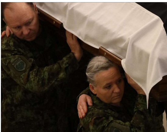
Sarka õlal kandes toetatakse seda välimise käega, pöörates peopesa vastu sarga külge, ja sarga alla jääv käsi asetatakse kaaslase välimisele õlale.