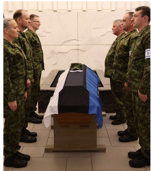
Sargameeskond liigub kahele poole sarka ja pöörab sargameeskonna pealiku märguande peale sarga suunas.