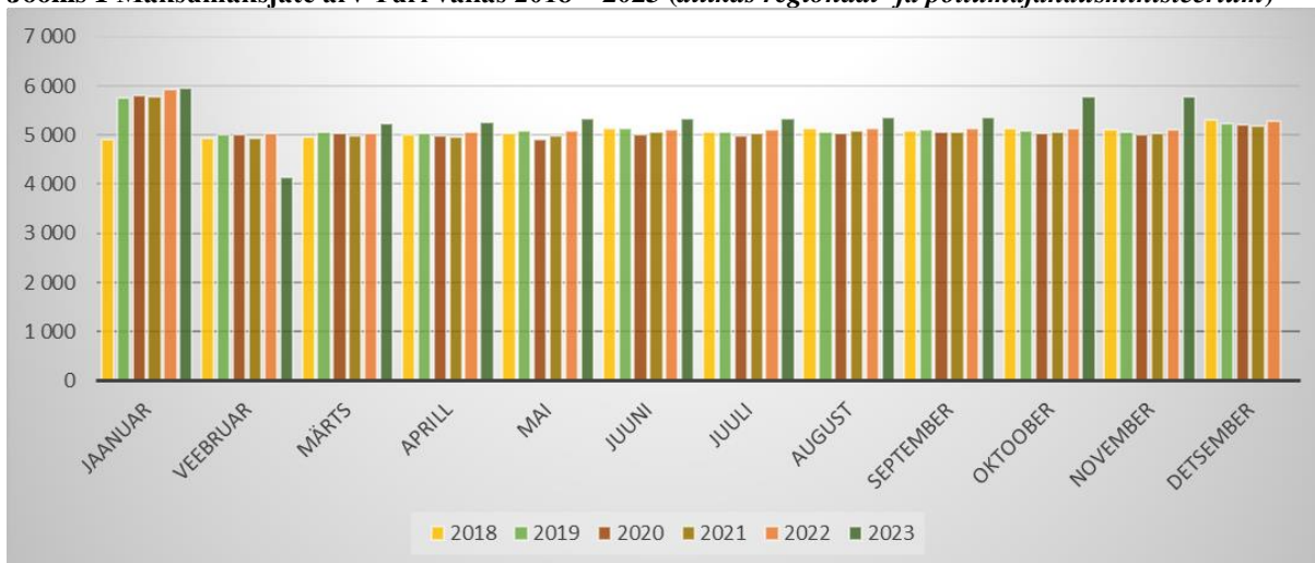
Joonis 1 Maksumaksjate arv Türi vallas 2018 – 2023

Maksumaksjate arv 2023. aasta jaanuarikuu seisuga oli 5936 inimest ja sama aasta novembris seisuga 5768 inimest. 2023. aasta keskmine maksumaksjate arv on 5345 inimest ja 2022. aasta keskmine maksumaksjate 5174 inimest.